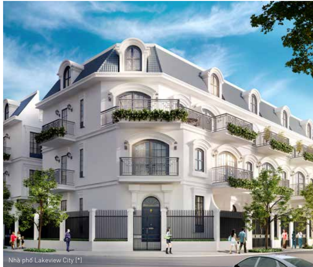
Nhà phố Lakeview City (*)