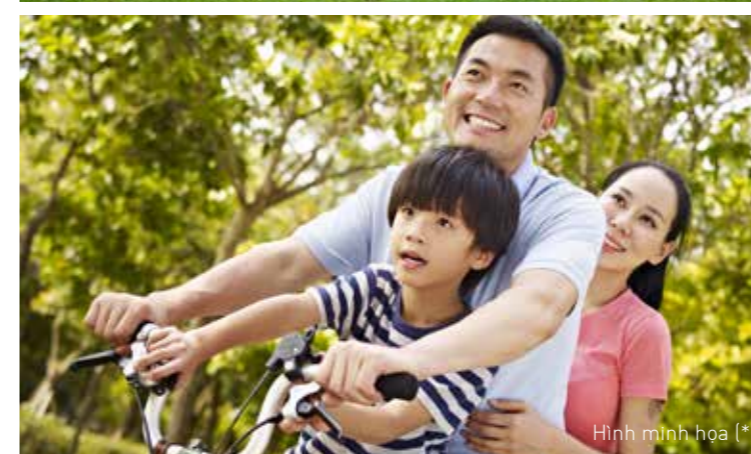
Hình minh họa (*)