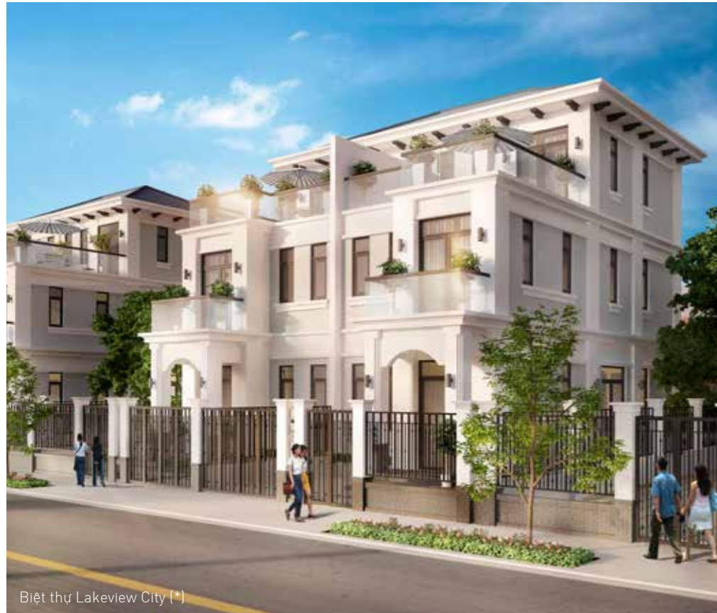
Biệt thự Lakeview City (*)