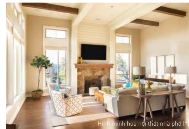
Hình minh họa nội thất nhà phố (*)

We promote an open airy space and maximizing the usable area in the design. The townhouse has an area range from 100 m 2 - 230 m 2 , suitable for modern life, easy to decoration for residents.