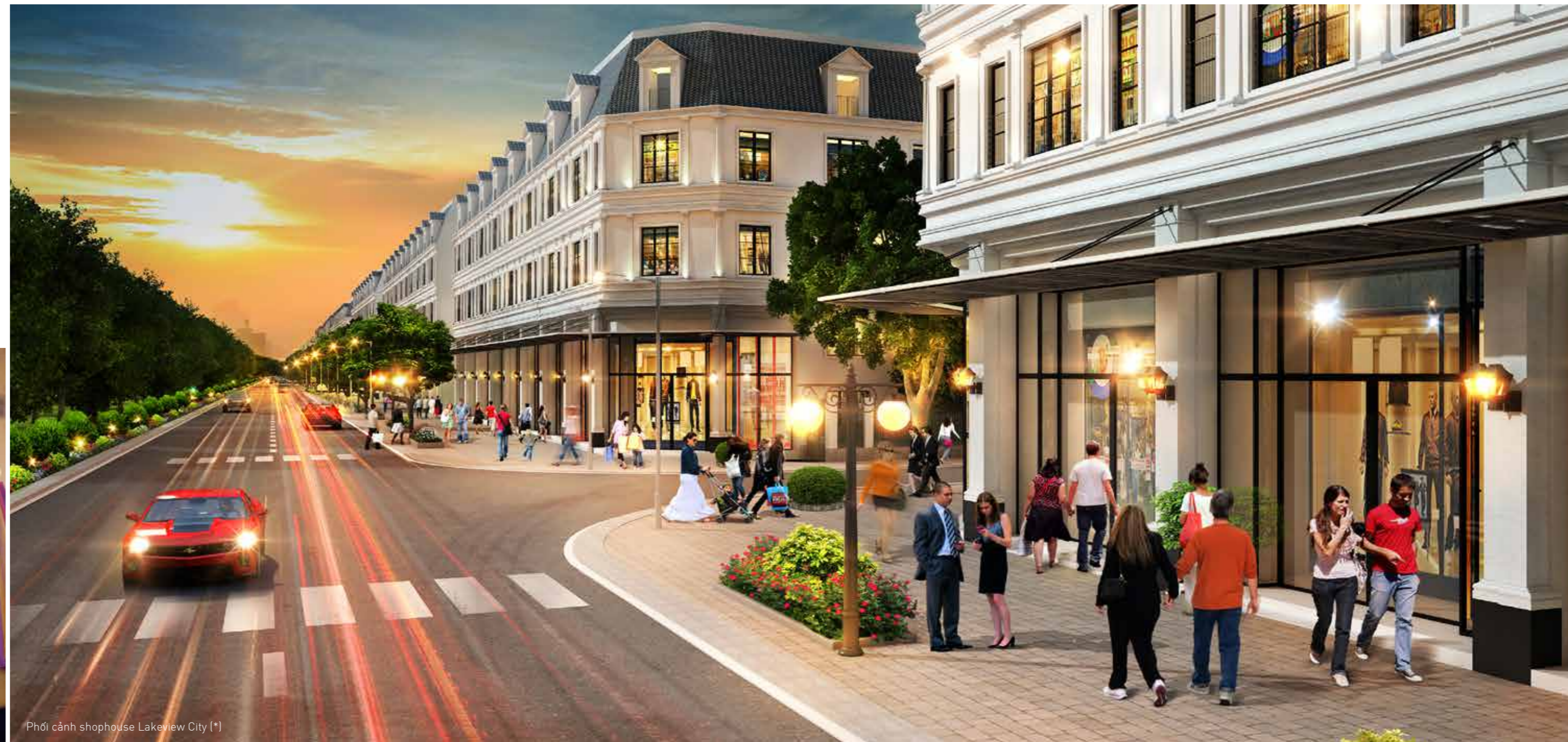
Phối cảnh shophouse Lakeview City (*)