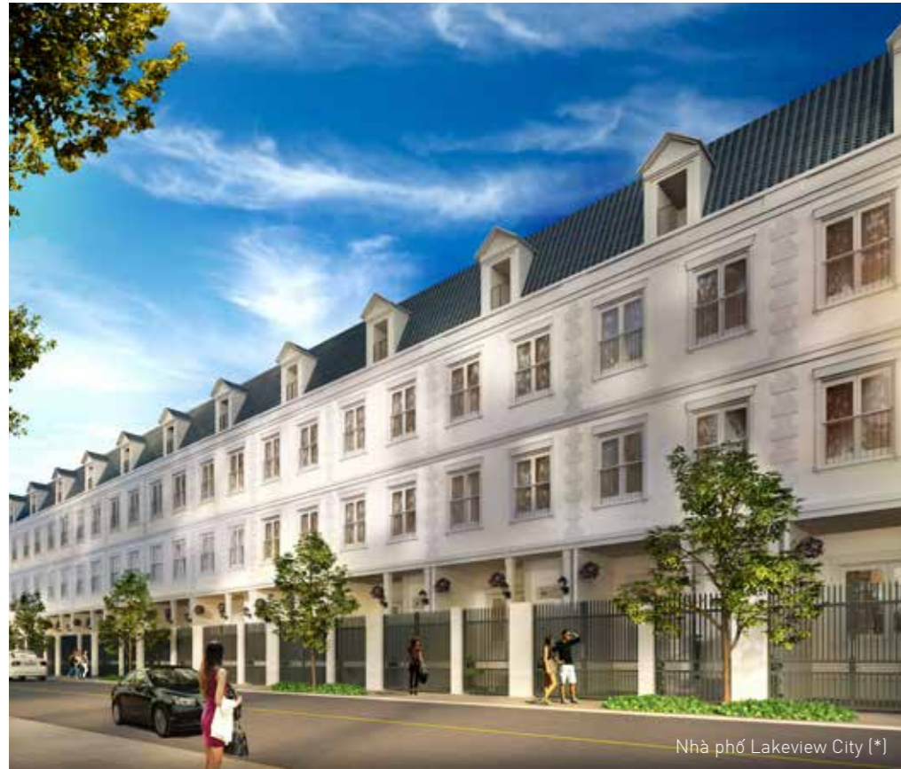
Nhà phố Lakeview City (*)