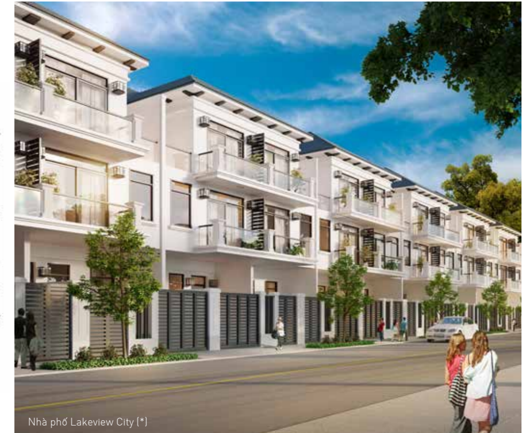
Nhà phố Lakeview City (*)