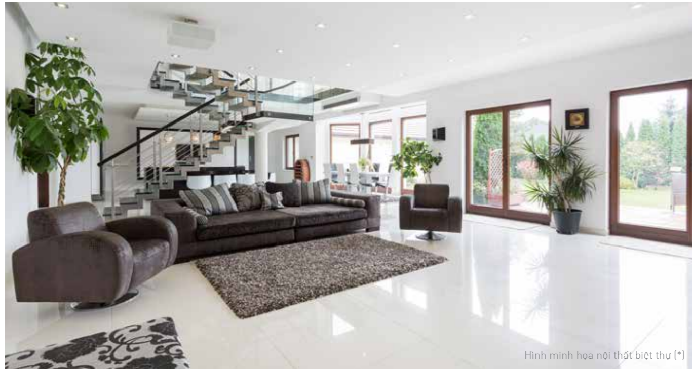
Hình minh họa nội thất biệt thự (*)

Semi Detached Villa is designed in a modern style, free space, airy and abundant with natural light. It is located next to the lake or the river, which are the prime locations of the project.