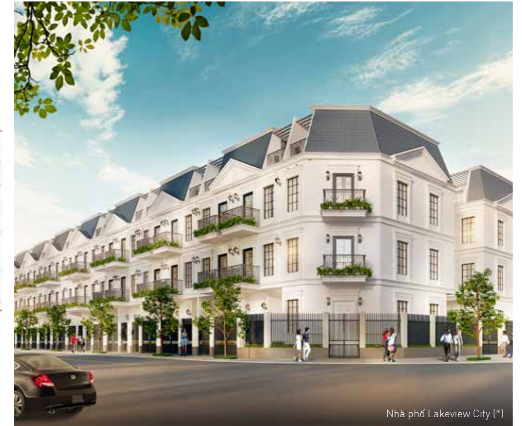
Nhà phố Lakeview City (*)