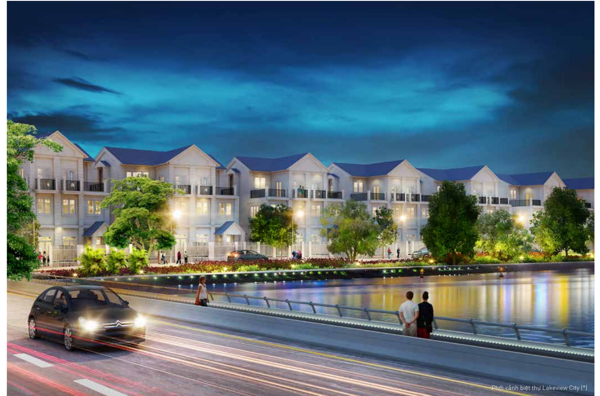
Phối cảnh biệt thự Lakeview City (*)