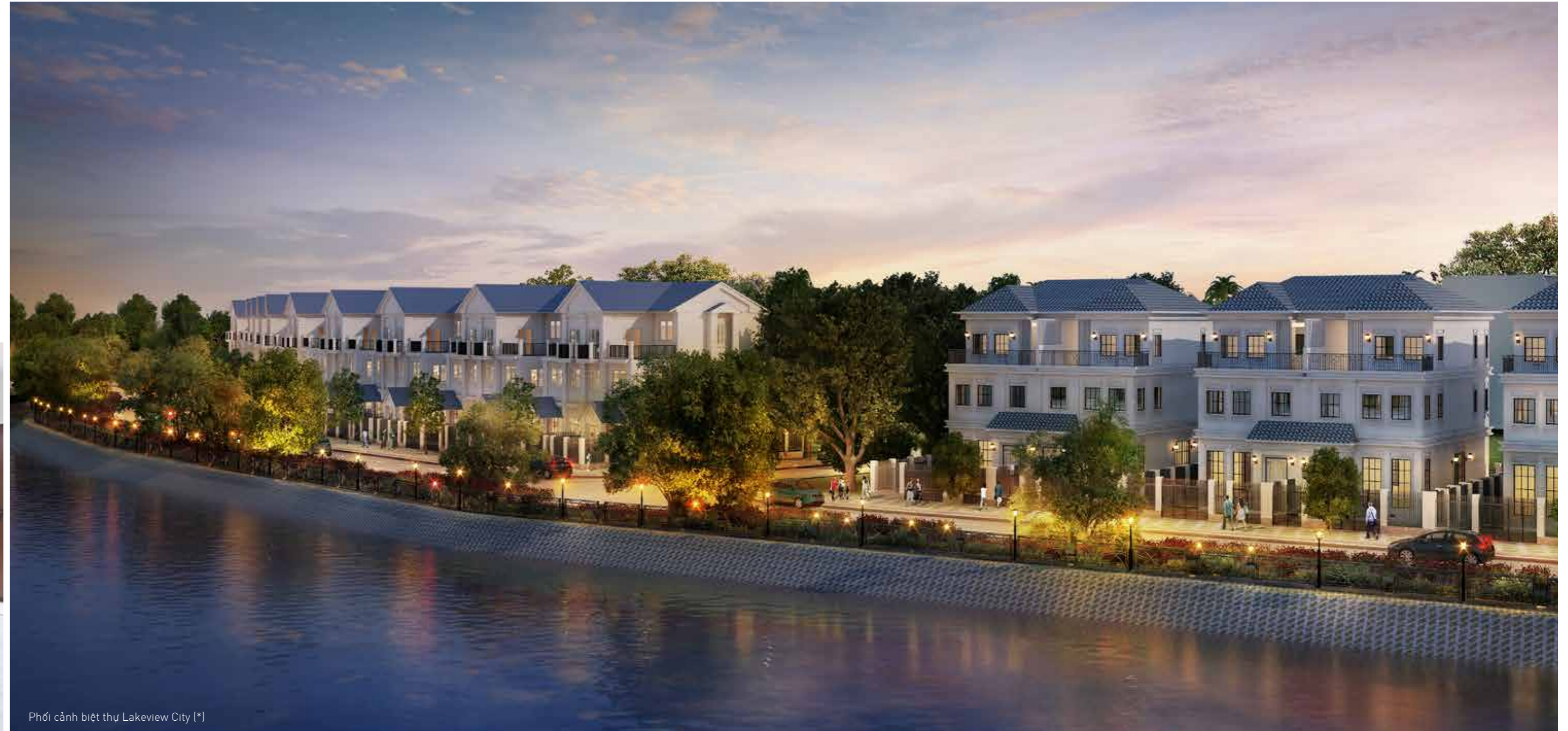
Phối cảnh biệt thự Lakeview City (*)