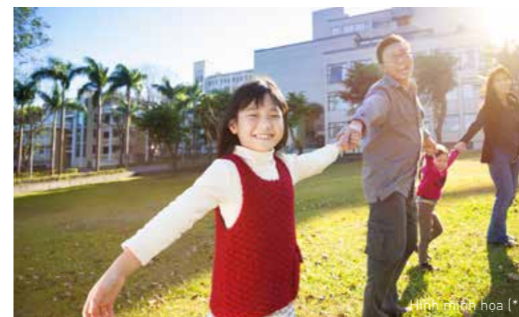
Hình minh họa (*)