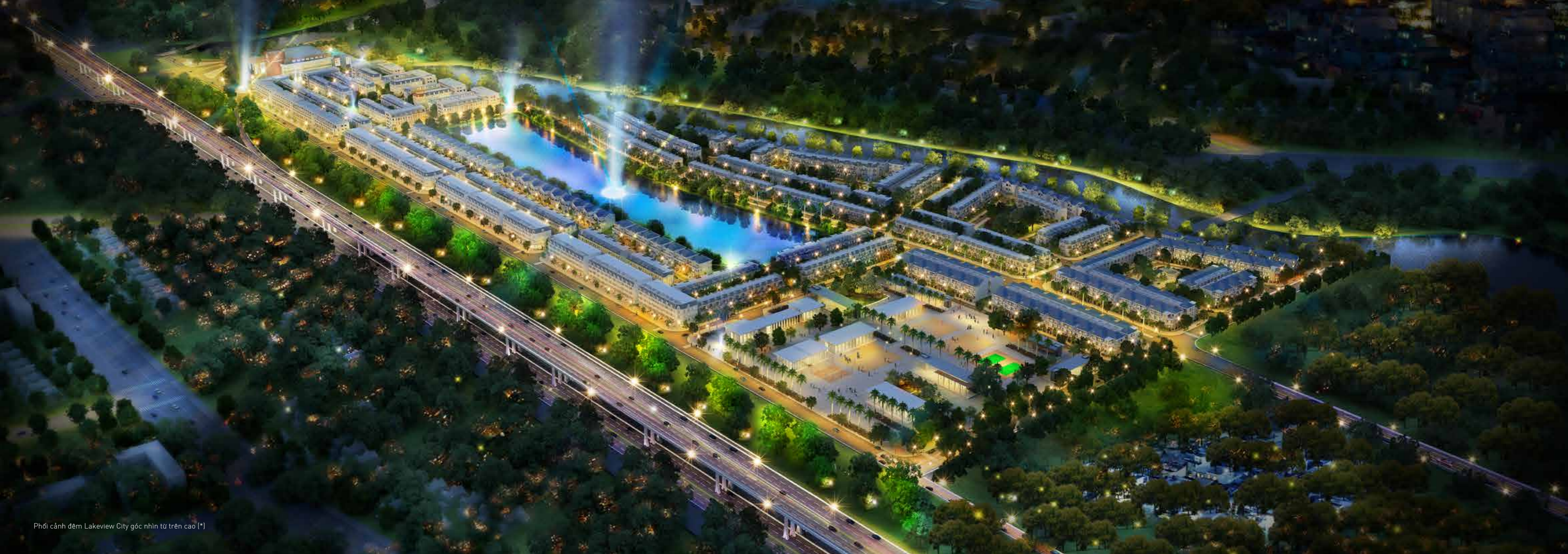
Phối cảnh đêm Lakeview City góc nhìn từ trên cao [*]