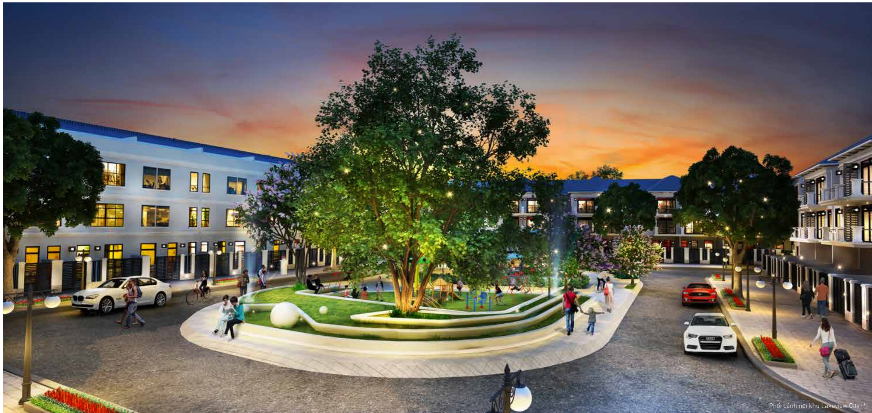
Phối cảnh nội khu Lakeview City (*)