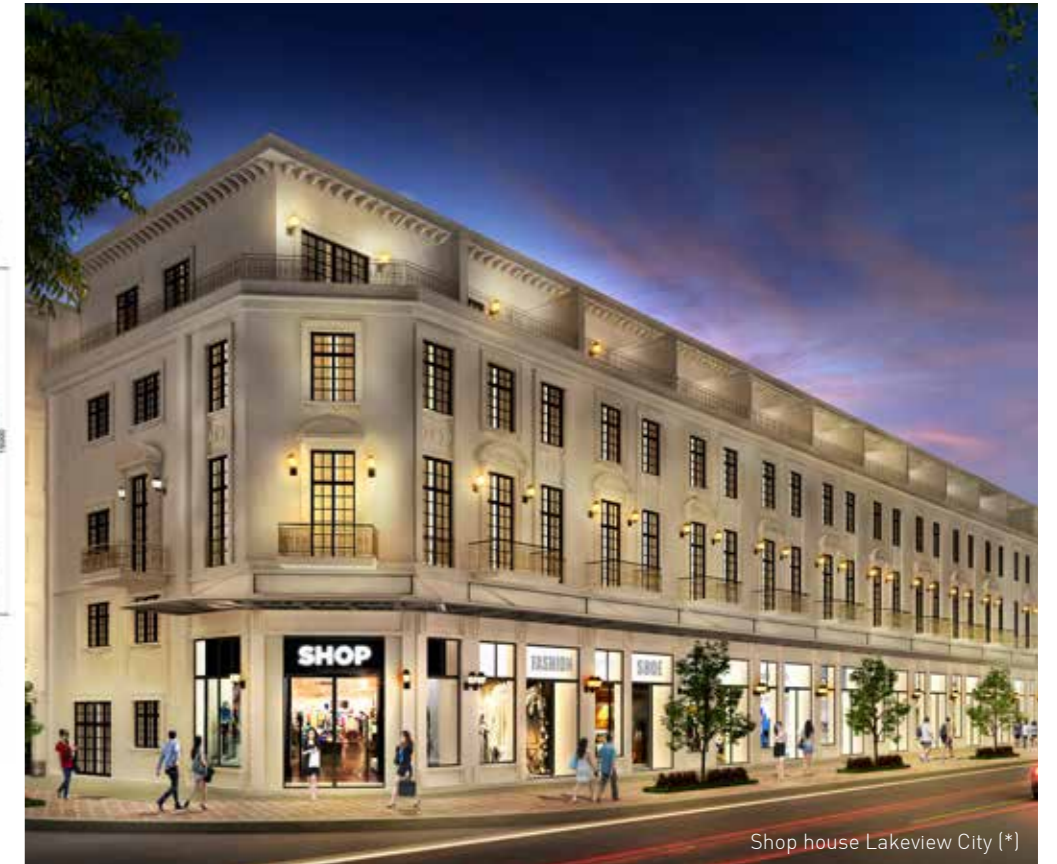
Shop house Lakeview City (*)