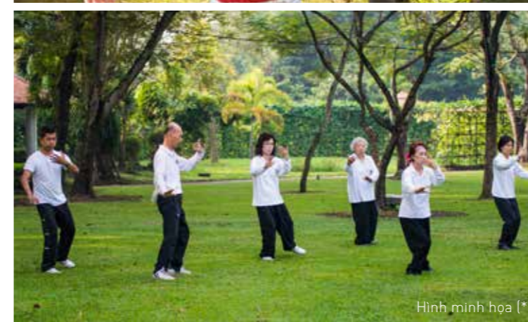
Hình minh họa (*)