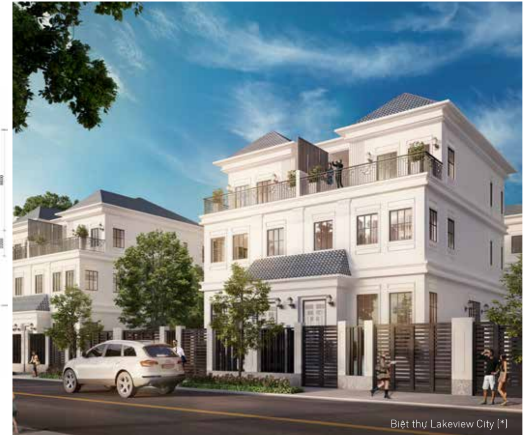
Biệt thự Lakeview City (*)