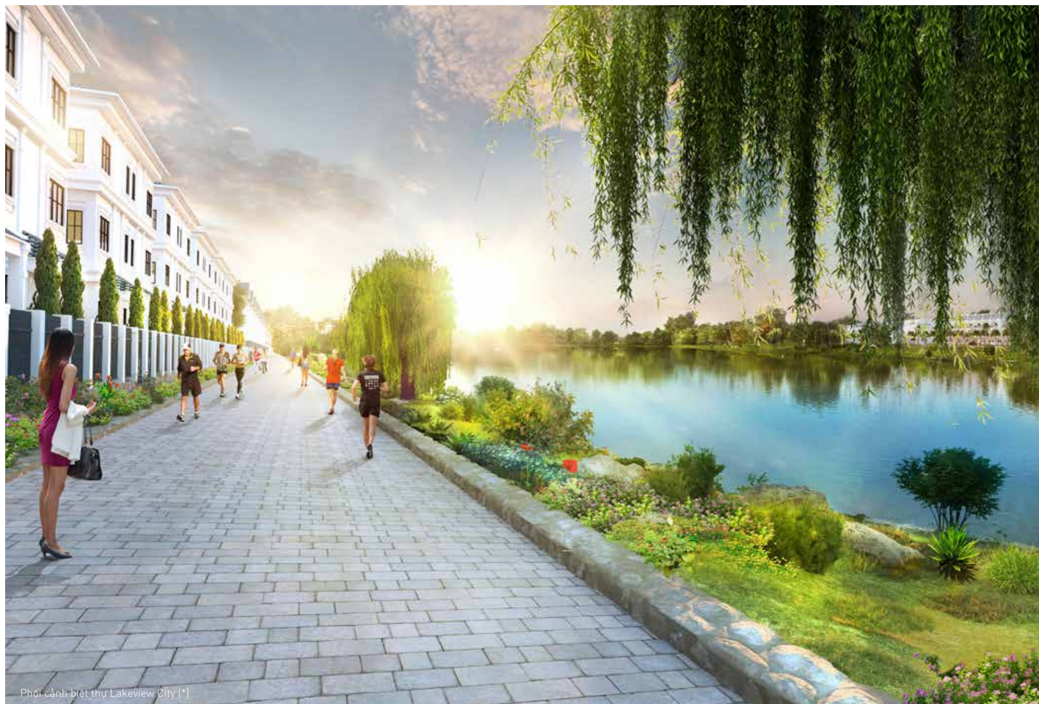
Phối cảnh biệt thự Lakeview City (*)