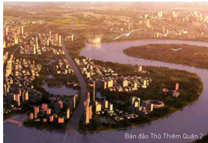
Bán đảo Thủ Thiêm Quận 2