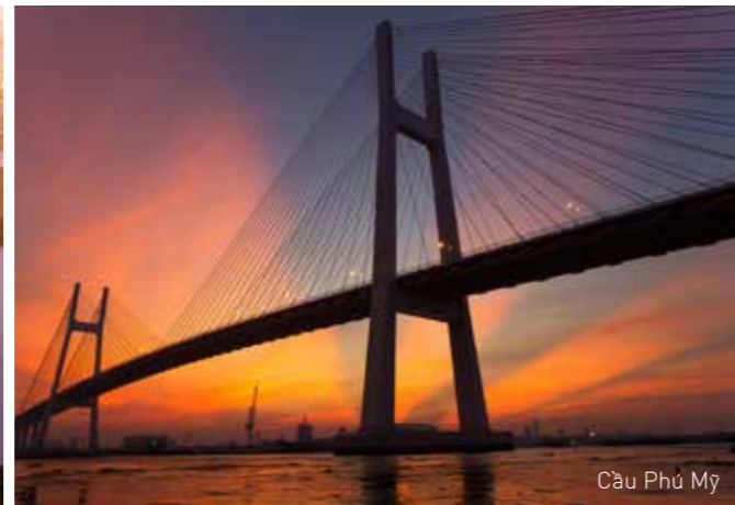
Cầu Phú Mỹ