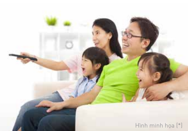
Hình minh họa (*)