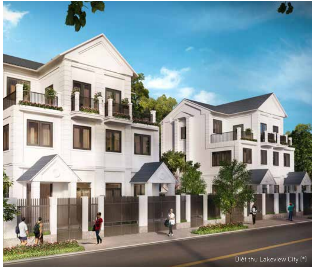
Biệt thự Lakeview City (*)