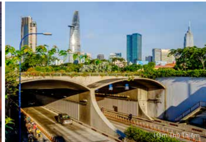
Hầm Thủ Thiêm