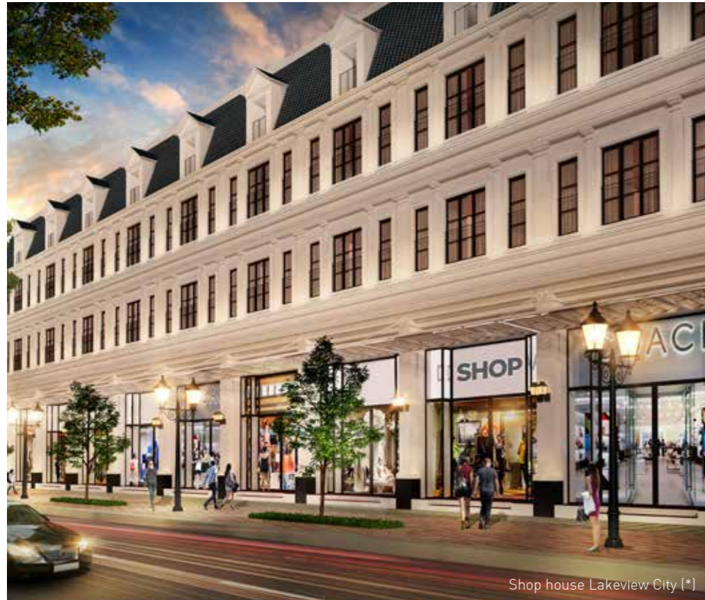
Shop house Lakeview City (*)