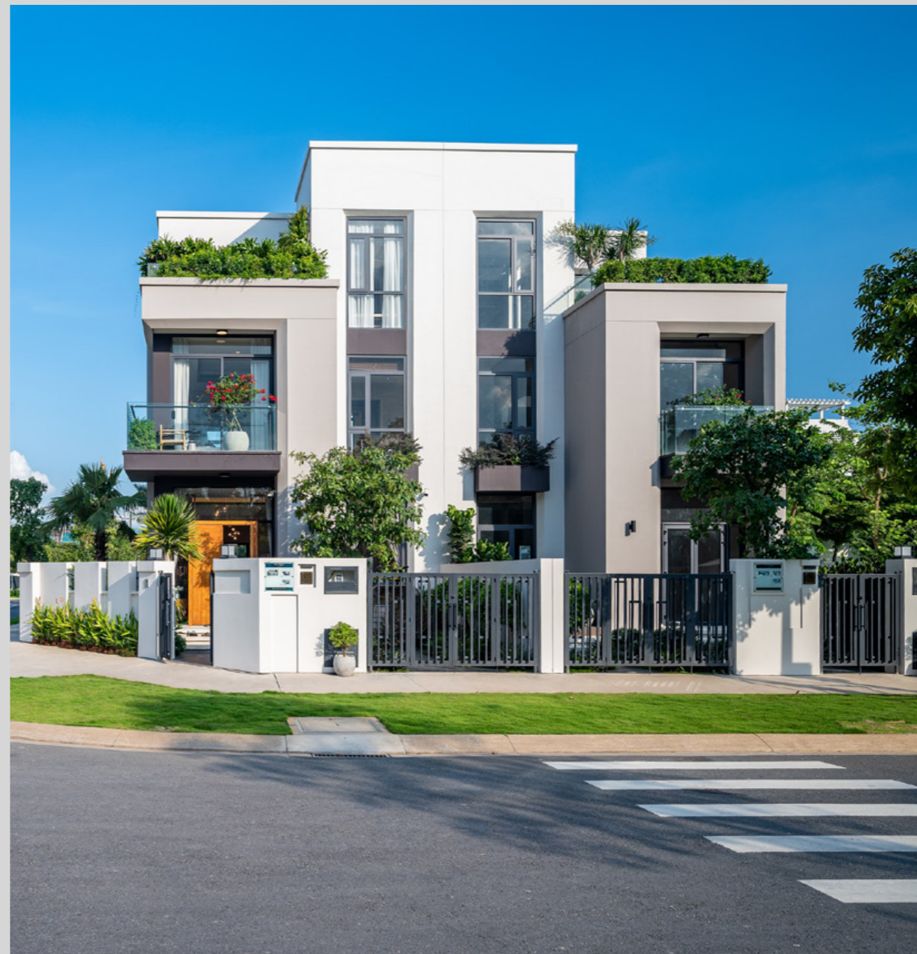
Không gian sống xanh đẳng cấp tại Aqua City _1 đang dần hoàn thiện.