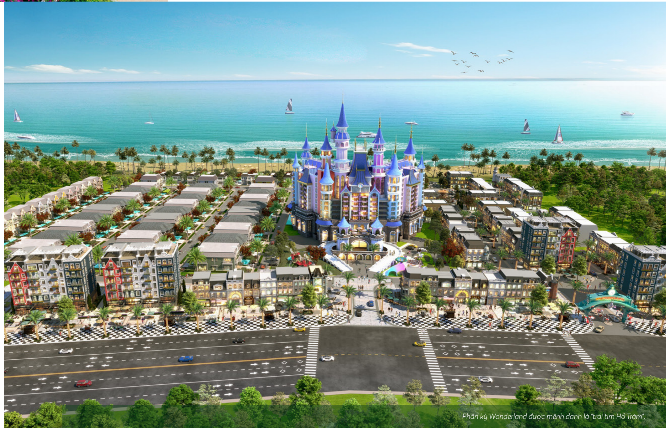
Phân kỳ Wonderland được mệnh danh là "trái tim Hồ Tràm".

Nhờ vị trí đặc địa, diện tích sử dụng lớn, thiết kế tối ưu 2 tầng 3 chìa khóa và phong cách sang trọng, shop villa Wonderland nhanh chóng vào tầm ngắm của những nhà đầu tư sành sỏi hay giới thành đạt, vừa thụ hưởng ngôi nhà thứ hai để nghỉ dưỡng và khai thác giá trị thương mại của BĐS du lịch tại các khu đô thị biển có tiềm năng cao (cho thuê, khai thác dịch vụ du lịch...). Đây chính là giá trị lợi nhuận kép mà dòng sản phẩm này đang mang lại cho khách hàng sở hữu.