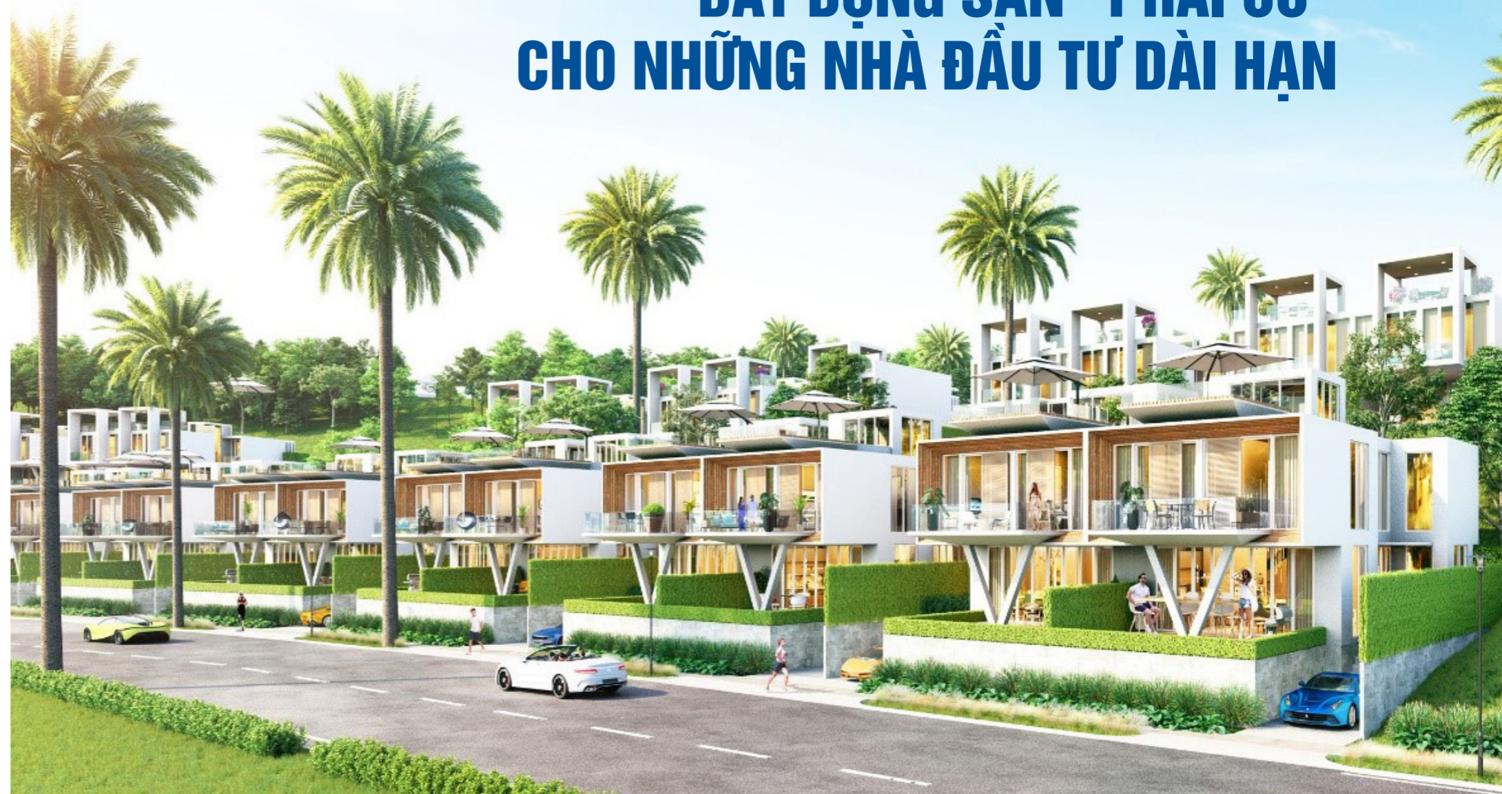
Second home – Biệt thự phân khu Waikiki trên cao độ hiếm có tại NovaWorld Phan Thiet (Bình Thuận) vừa ra mắt mới đây.