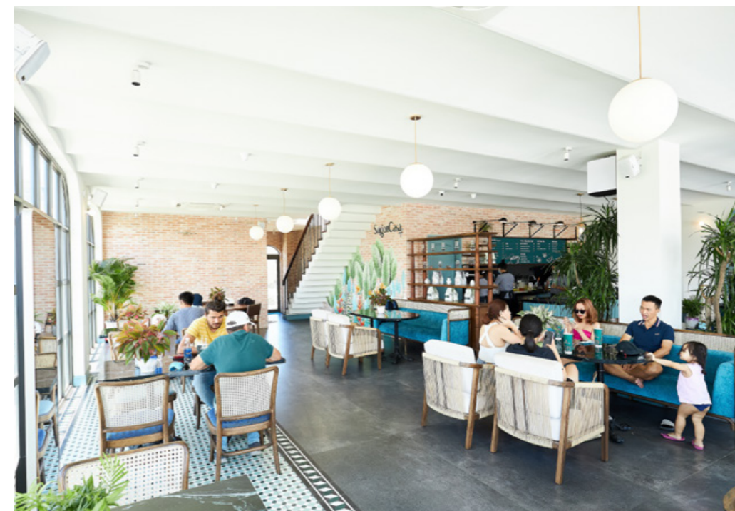
Saigon Casa Café - một thương hiệu thu hút khách nhộn nhịp tại dãy phố thương mại The Tropicana.

Sở hữu shophouse The Tropicana - NovaWorld Ho Tram