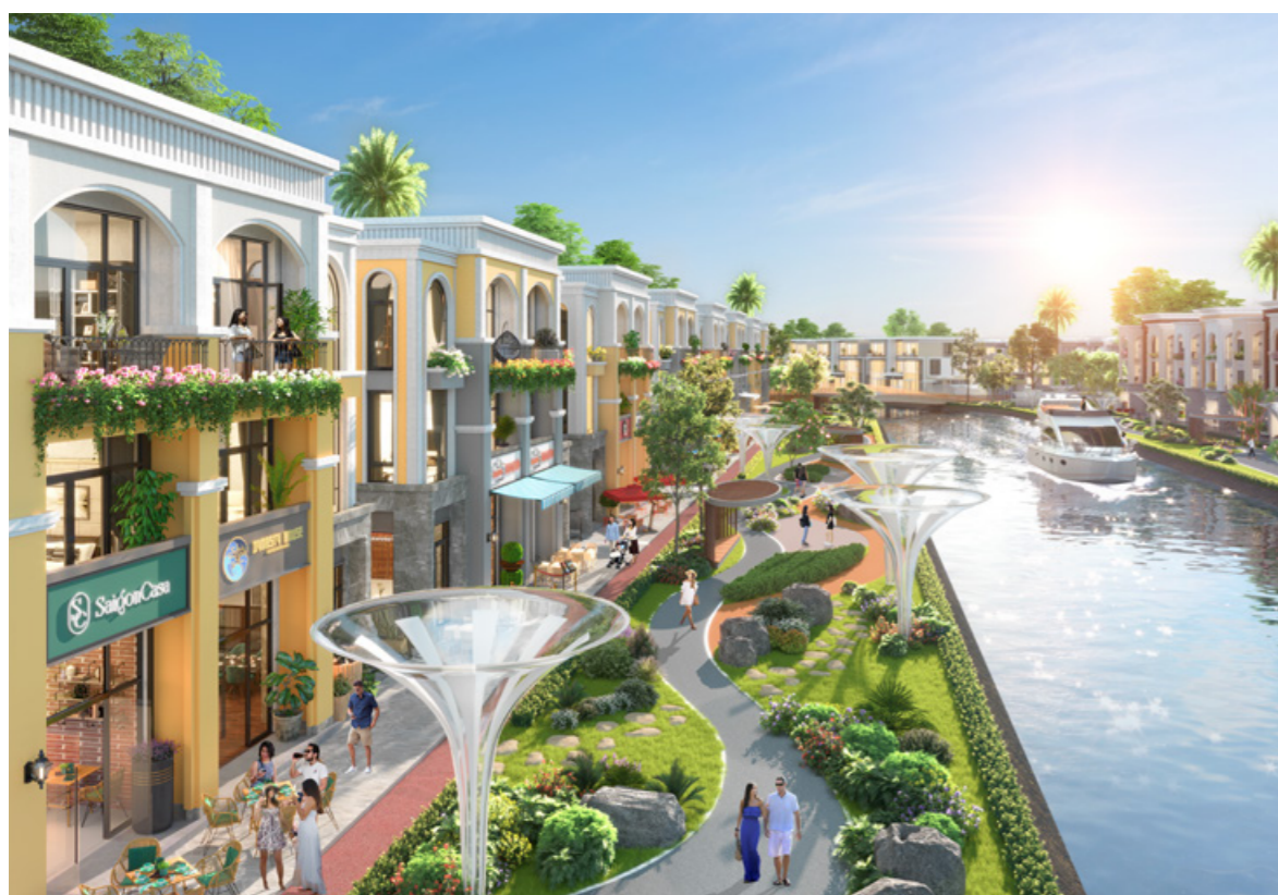
Không gian sông sinh thái, tiện nghi tại đô thị đảo Phượng Hoàng, Aqua City.