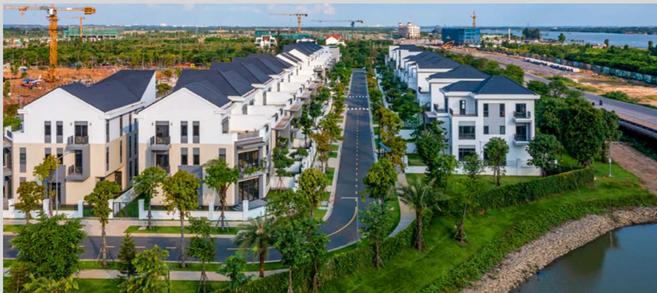
Aqua City chuyển mình mạnh mẽ từng ngày. Diện mạo của một khu đô thị sinh thái quy mô, hiện đại và giàu sức sống đang dần hình thành.