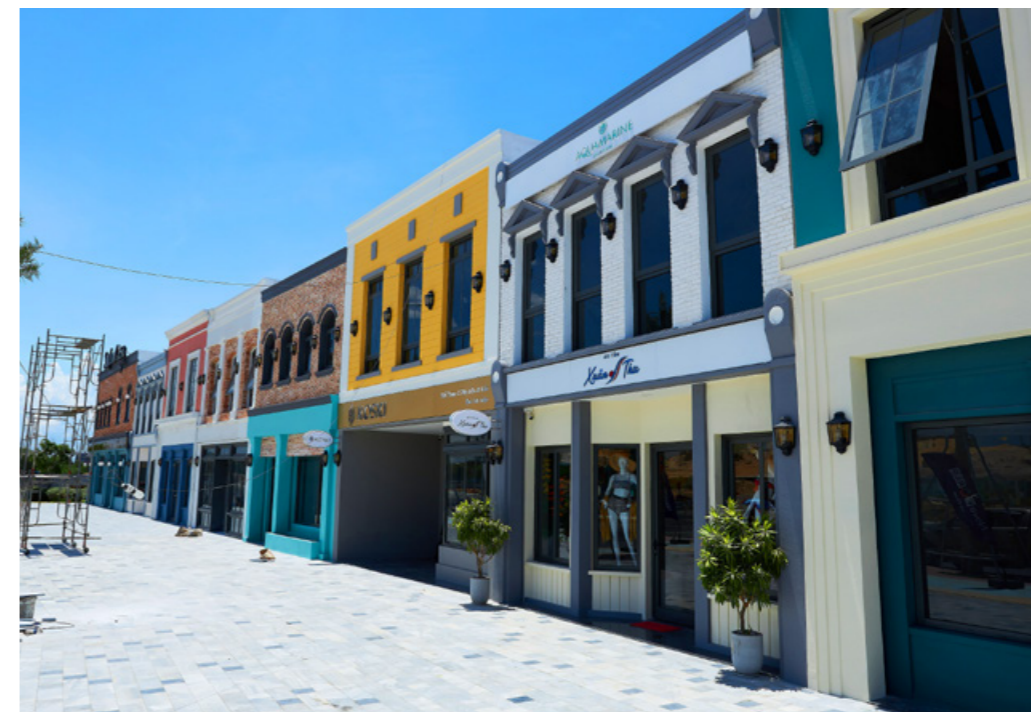
Shophouse biển tại NovaWorld Ho Tram được quy hoạch đa dạng ngành nghề

Chuỗi shophouse đã hoàn thiện tại NovaWorld Ho Tram.