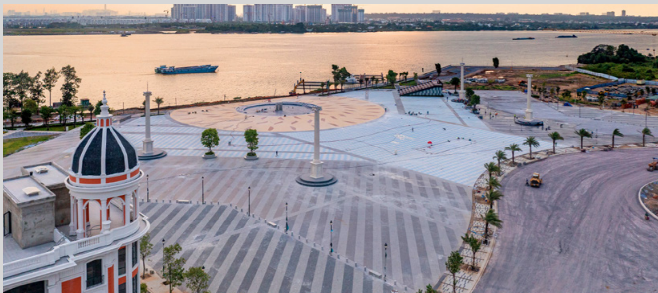
Tổ hợp Quảng trường - Bến du thuyền Aqua Marina đẳng cấp đang trong giai đoạn hoàn thiện để ra mắt vào tháng 8 này.