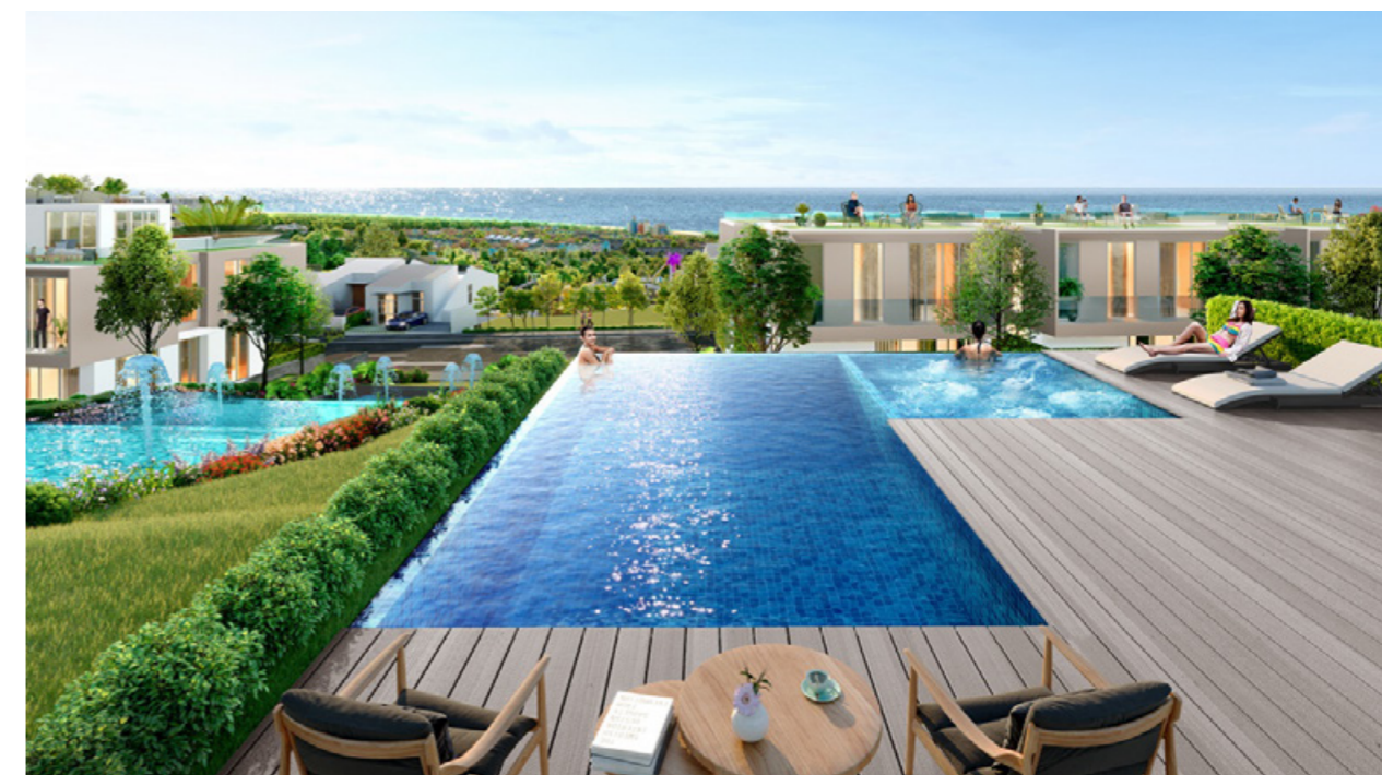
Không chỉ kể cận loạt tiện ích đẳng cấp, mỗi căn biệt thự Waikiki cũng là một khu resort thu nhỏ với nhiều tiện ích như hồ bơi, spa, lounge, sky deck...

riêng tư và sang trọng. Đặc biệt, dòng Biệt thự hạng sang này nằm trên địa hình dốc với cao độ độc đáo 52 - 70m so với mực nước biển, được quy hoạch xây dựng thành hình cánh cung bao quanh thung lũng. Địa thế hiếm có này mang đến tầm nhìn "đa tầng" độc nhất, không chỉ bao quát toàn cảnh vịnh Phan Thiết, mà còn thu trọn vào tầm mắt thế giới giải trí sắc màu, sôi động của công viên chủ đề Ocean Kingdom 25ha phía dưới. Đây cũng là tầm nhìn "mơ ước", hiếm có của giới thượng lưu trên khắp thế giới.