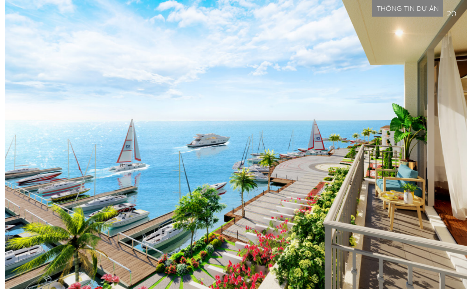
Bến du thuyền đặc quyền dành cho cư dân Habana Island.

Tại Việt Nam, dù dịch bệnh ảnh hưởng đến thị trường du lịch nghỉ dưỡng, nhiều nhà đầu tư xem đây là cơ hội tốt để sở hữu second home với giá hợp lý. Định vị ở phân khúc hạng sang, biệt thự biển tại Habana Island thuộc NovaWorld Ho Tram (Bà Rịa – Vũng Tàu) nhanh chóng lọt vào "mắt xanh" của giới nhà giàu vì toạ lạc ở địa thế hiếm có. Bán đảo này nằm ở vị trí sông Ray đổ ra biển Đông, chỉ cách cung đường biển chính của Hồ Tràm 2 km. Nhờ vậy, second home tại đây vừa cực kỳ riêng tư, tách biệt, vừa có tính kết nối hoàn hảo.