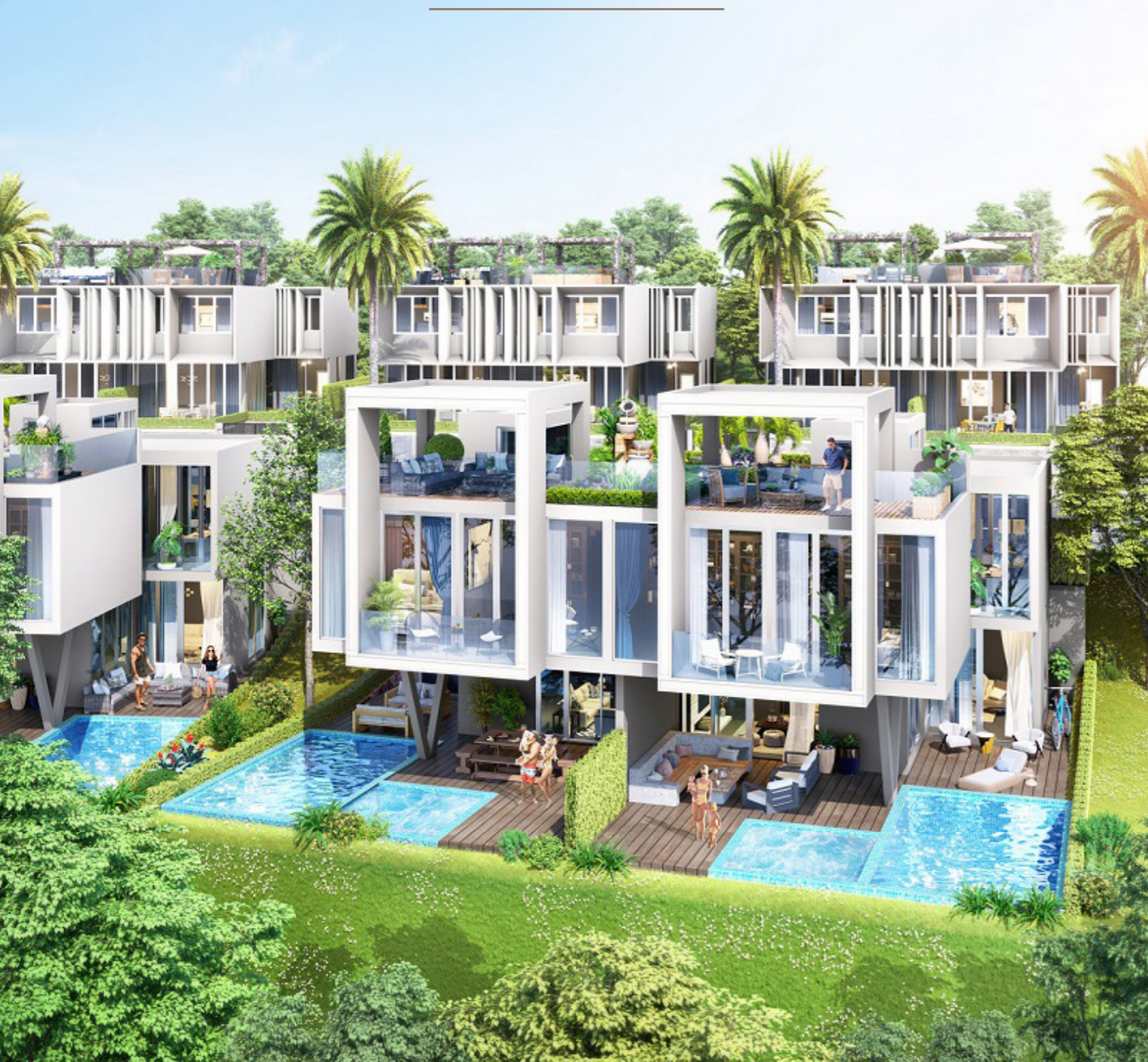
Phân khu Waikiki áp dụng phong cách kiến trúc hiện đại, tối giản, chú trọng không gian mở, tối ưu trải nghiệm với nhiều không gian chức năng đặc sắc.

Tại Phan Thiết – Bình Thuận, siêu dự án đô thị biển NovaWorld Phan Thiet của Novaland vừa cho ra mắt siêu phẩm Biệt thự Waikiki với số lượng cực kỳ khan hiếm, ngay lập tức gây chú ý trong giới đầu tư lẫn nhà sưu tập BĐS hạng sang bởi loạt ưu thế độc nhất.