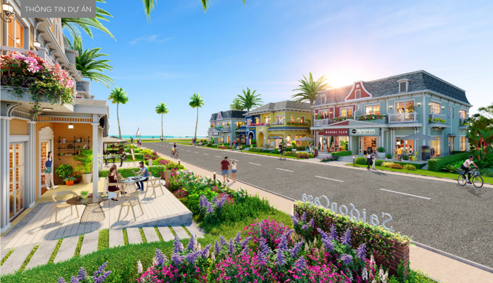
Mô hình độc hiếm shop villa tại phân kỳ Wonderland – NovaWorld Ho Tram