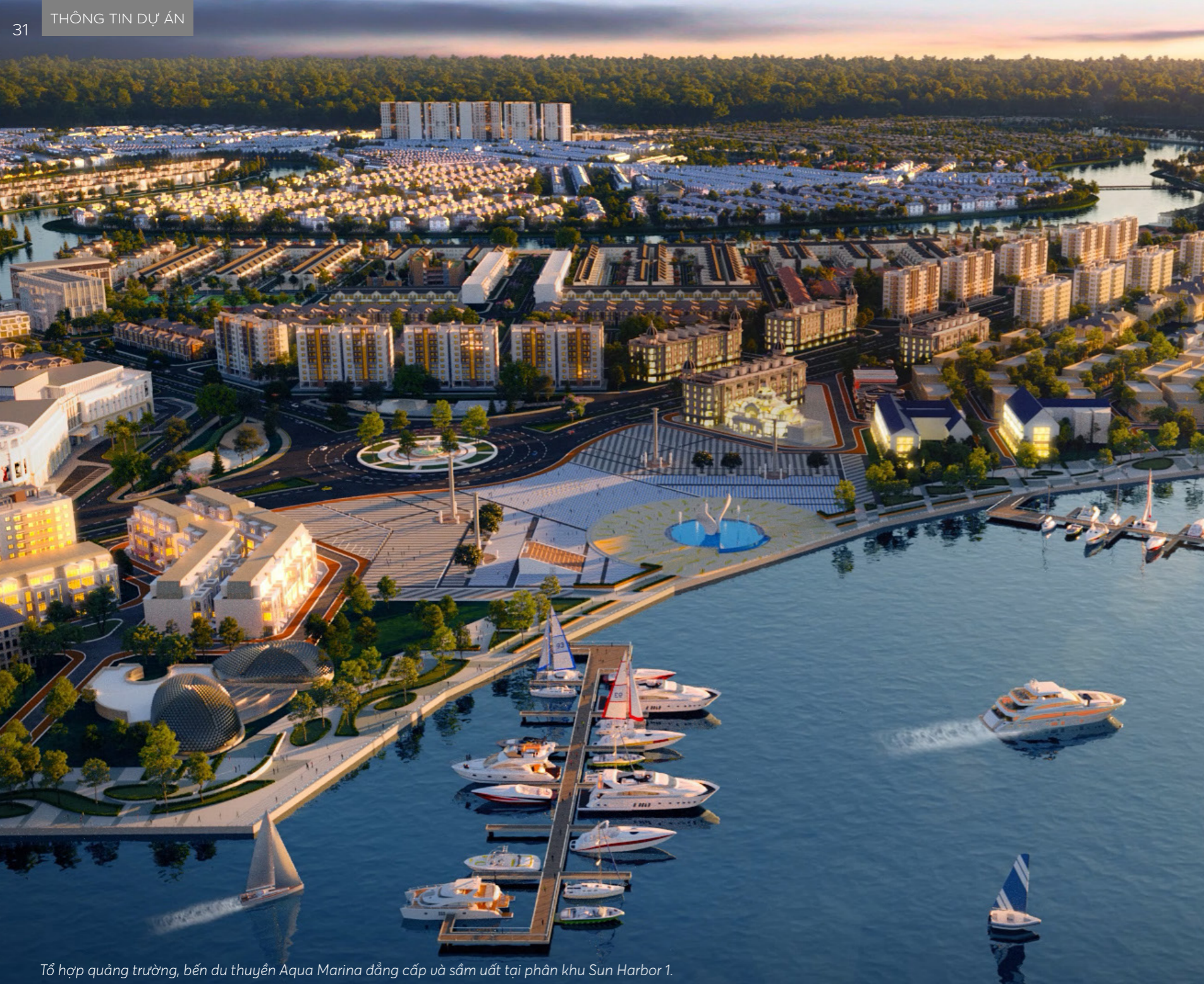
Tổ hợp quảng trường, bến du thuyền Aqua Marina đẳng cấp và sầm uất tại phân khu Sun Harbor 1.