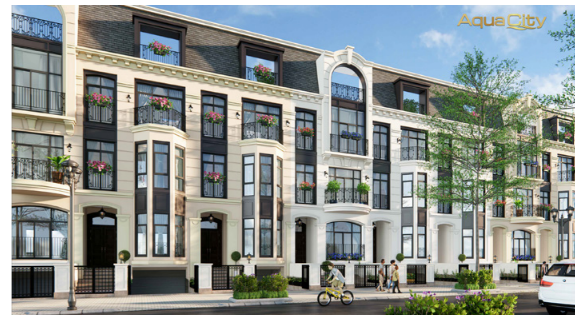
Nhà phố phong cách British Royal tại Sun Harbor 1 tại Aqua City.

Giá trị của BĐS gắn liền với sức sống của đô thị và mọi con đường đều đổ về trung tâm. Khi tổ hợp Quảng trường - bến du thuyền Aqua Marina hay khu resort tiêu chuẩn 4 sao Aqua City Resort by Fusion được đưa vào vận hành, phân khu Sun Harbor 1 và toàn khu đô thị Aqua City sẽ là điểm đến lý tưởng của cộng đồng tinh hoa. Điều này càng khiến nhà phố tại Sun Harbor 1 không ngừng gia tăng giá trị.