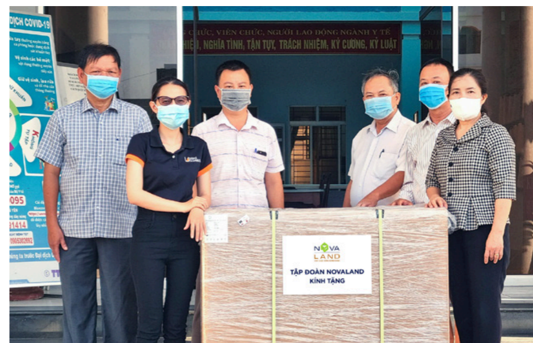
Tập đoàn Novaland trao tặng thiết bị y tế cấp thiết đến tỉnh Phú Yên hỗ trợ tuyến đầu chống dịch.

Bên cạnh chương trình lần này, trước đó, Tập đoàn Novaland đã trao tặng trực tiếp đến Sở Y tế tỉnh Phú Yên máy tách chiết tự động nhằm sử dụng xét nghiệm nhanh Covid-19, trao tặng trực tiếp máy lọc máu liên tục, máy giúp thở, phòng cách ly áp lực âm đến Bệnh viện Nhân dân 115 TP.HCM; trao tặng 02 xe cấp cứu đến Trung tâm Cấp cứu 115 TP.HCM, và sắp tới đây là việc trao tặng thiết bị y tế đến tỉnh Bình Thuận.