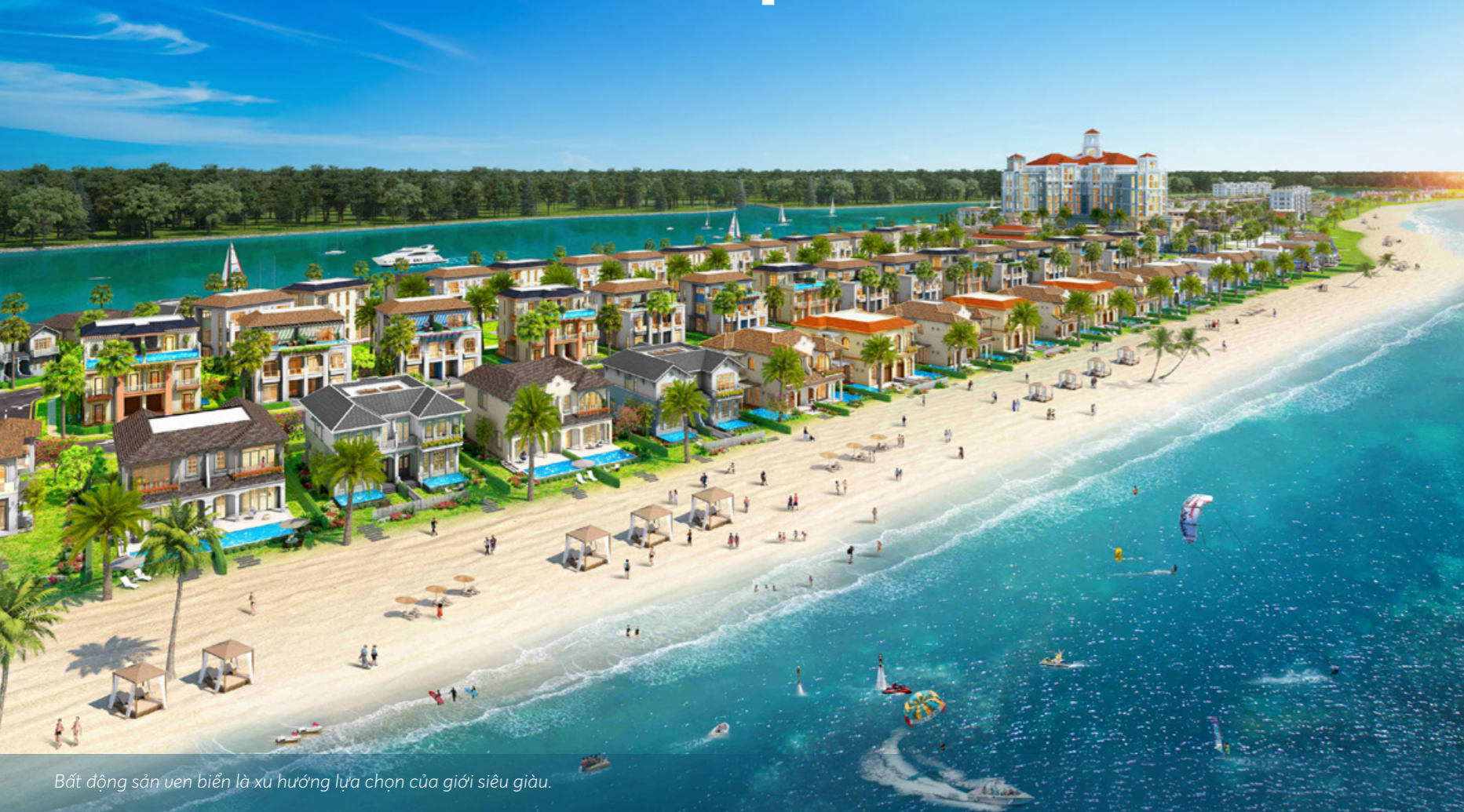
Bất động sản ven biển là xu hướng lựa chọn của giới siêu giàu.