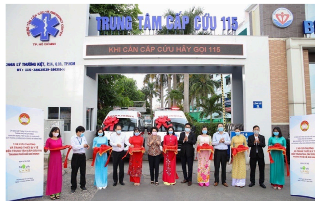
Tập đoàn Novaland trao tặng 2 xe cấp cứu cho bệnh viện 115.