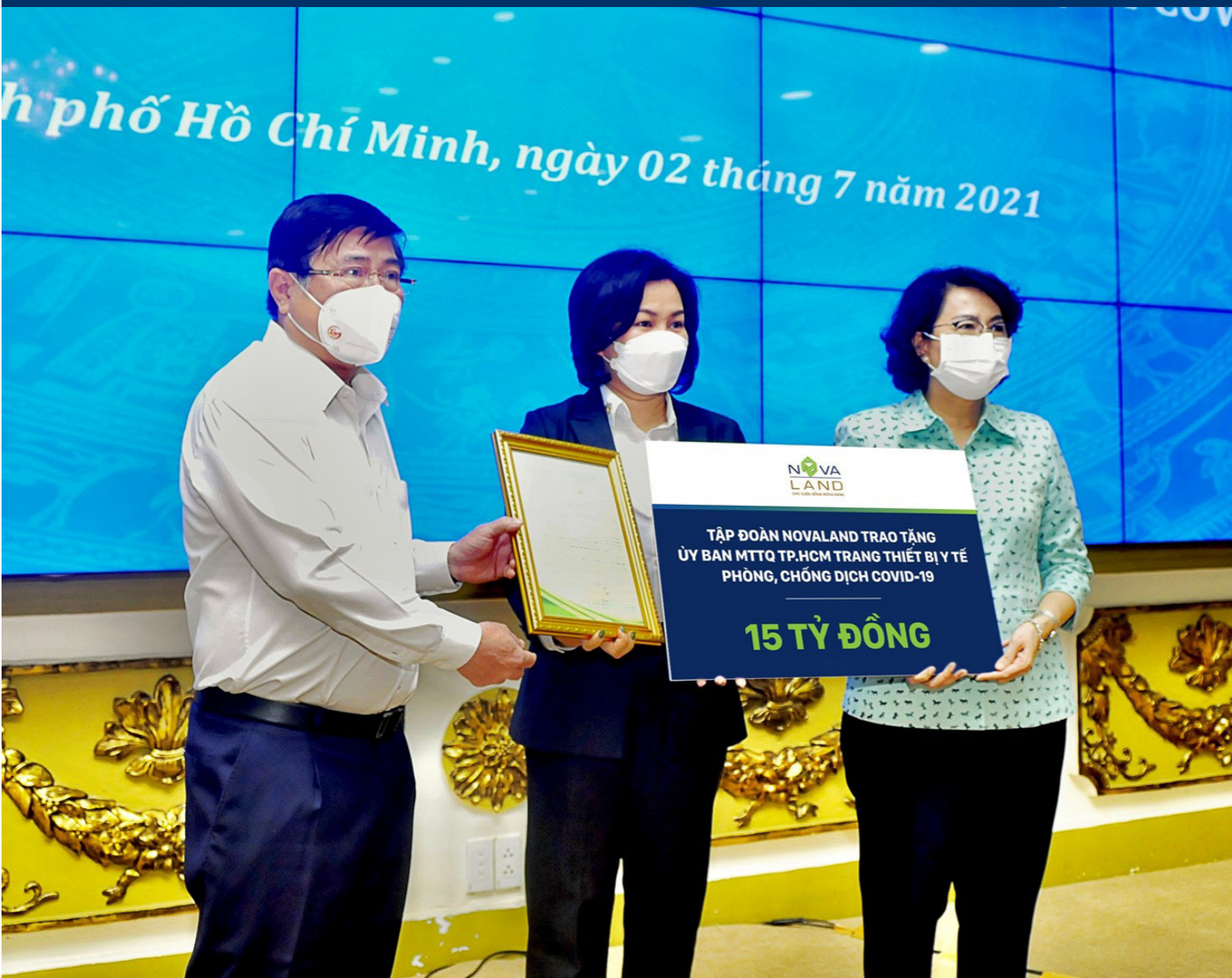
Đại diện Novaland trao tặng trang thiết bị y tế phòng, chống dịch Covid -19 đến UBMTTQ TP.HCM.

sự hỗ trợ về vắc xin cũng như các trang thiết bị y tế chuyên dụng, cấp thiết, công nghệ cao phục vụ công tác phòng chống và điều trị dịch bệnh được hiệu quả, nhanh chóng mà Novaland đã và đang triển khai tại nhiều tỉnh thành trên cả nước.