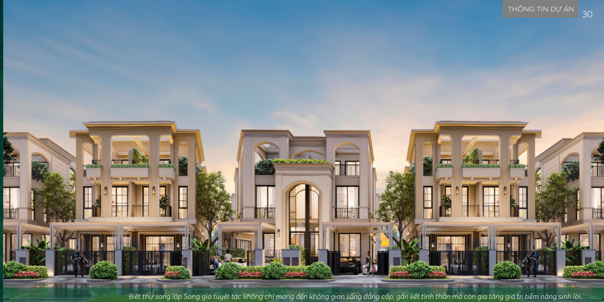
Biệt thự song lập Song gia tuyệt tác không chỉ mang đến không gian sống đẳng cấp, gắn kết tình thân mà còn gia tăng giá trị tiềm năng sinh lời.

Biệt thự song lập “ Song gia tuyệt tác ” vừa ra mắt tại đô thị đảo Phượng Hoàng, Aqua City có thiết kế sang trọng, đề cao sự gắn kết tình thân với chi phí dễ tiếp cận, và tối ưu hiệu quả đầu tư.