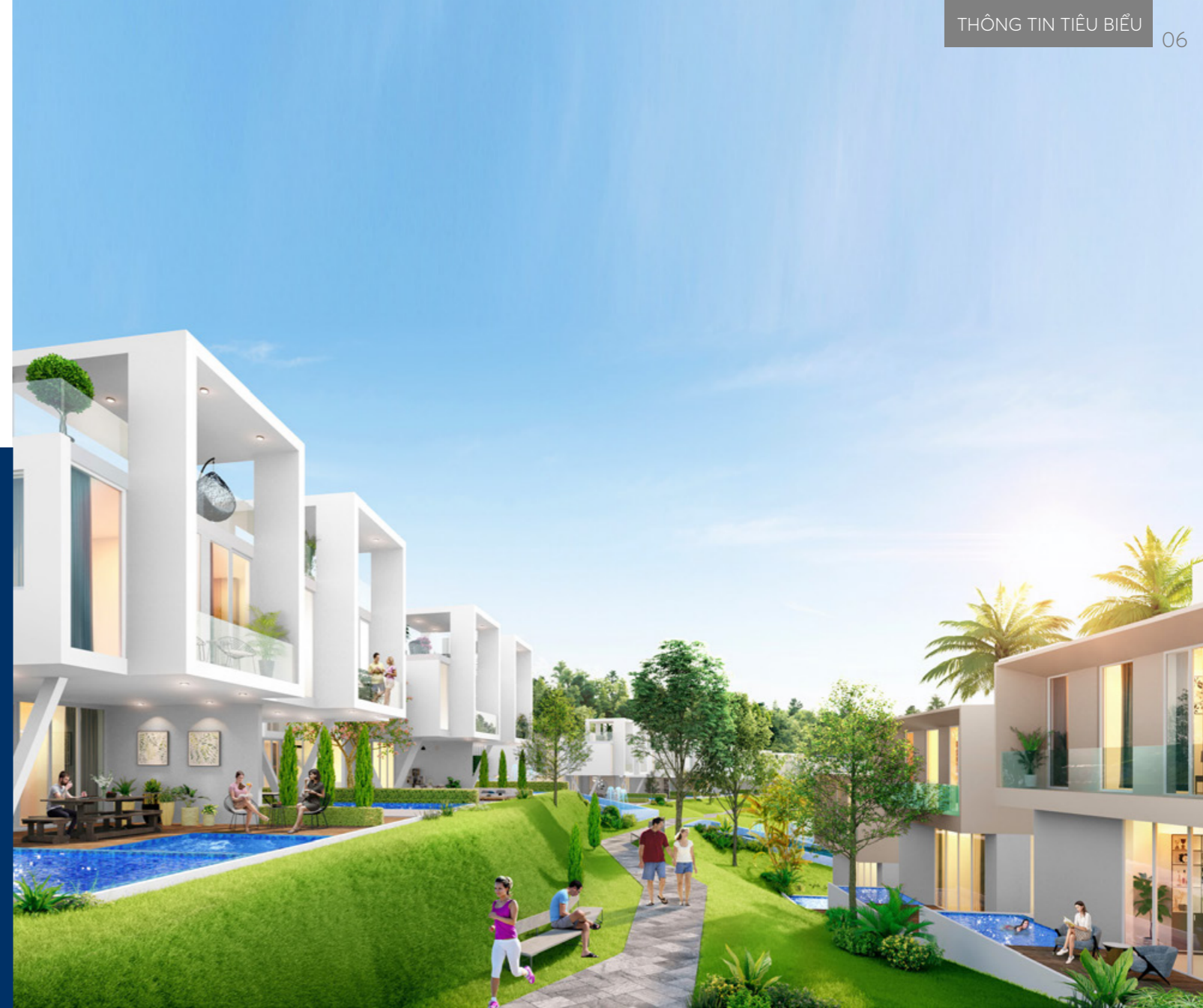
Phối cảnh Biệt thự Waikiki tại NovaWorld Phan Thiet (Bình Thuận)