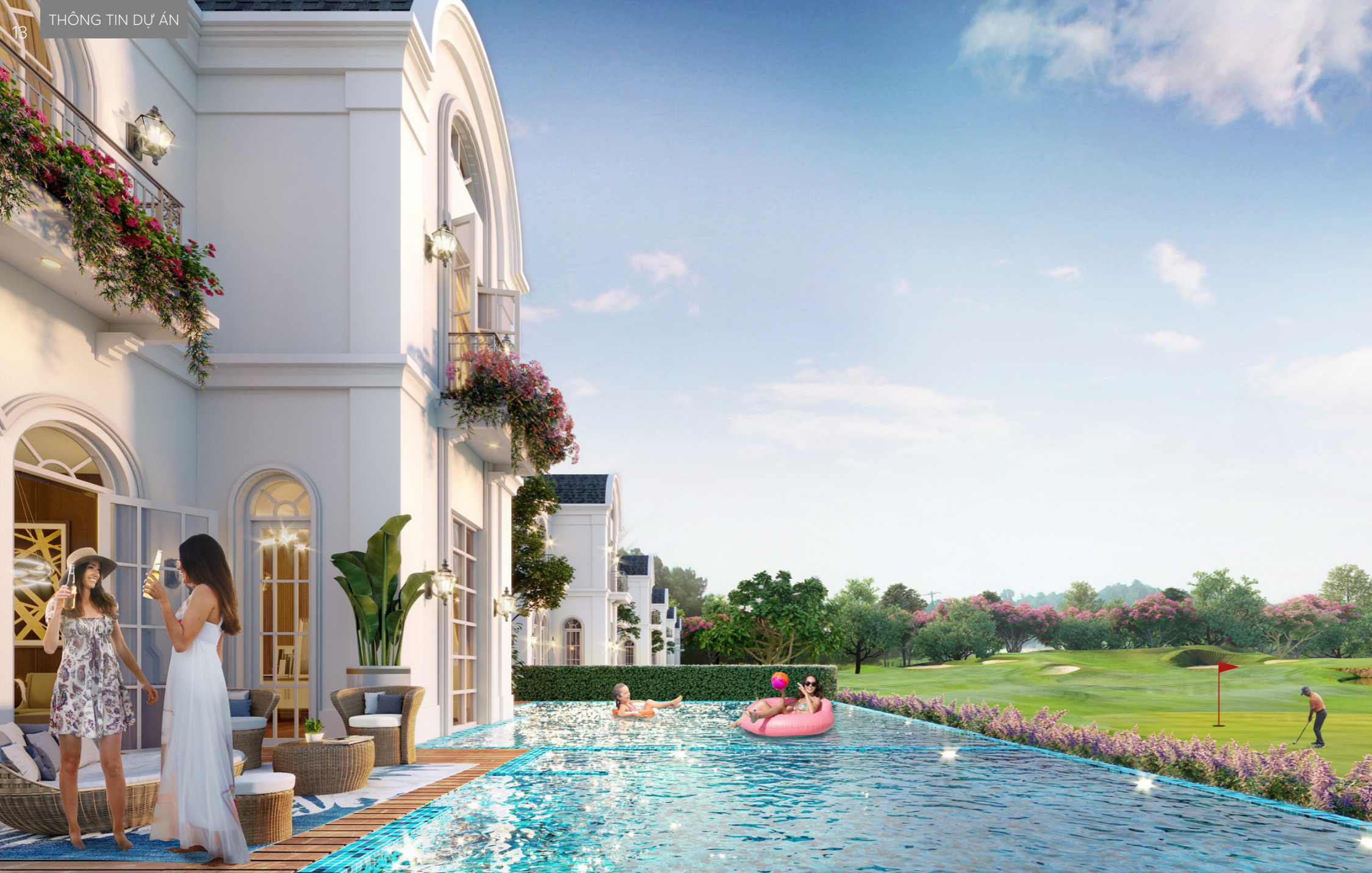
PGA Golf Villas tại NovaWorld Phan Thiet (Bình Thuận) được đánh giá cao bởi phong cách thiết kế phóng khoáng, sang trọng và hiện đại.