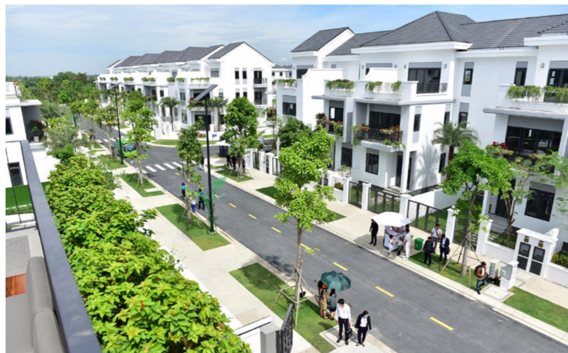
Khu phố phong cách Châu Âu tại Aqua City ra mắt vào tháng 11/2020.

Sau 2 năm ra mắt, Aqua City không ngừng "thay da đổi thịt" và đang dần hiện rõ hình thể của một đô thị đáng sống hàng đầu khu vực. Song song với quá trình xây dựng và phát triển các công trình nhà ở, hàng loạt các tiện ích liên tục được hoàn thiện như khu phố mẫu, khu thể thao ngoài trời, chuỗi clubhouse hiện đại... để đảm bảo vận hành năm 2023, đồng bộ cùng "điểm rơi" về hạ tầng giao thông.