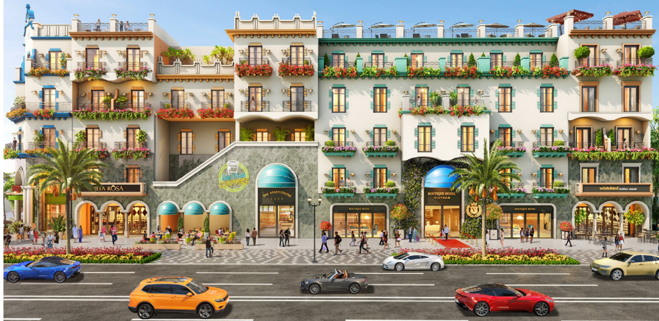
Phối cảnh boutique hotel đầu tiên tại Phan Thiết, thuộc dự án NovaWorld Phan Thiet.

Boutique Hotel là loại hình lưu trú có quy mô phòng ít nhằm chú trọng tăng cường và cá nhân hóa chất lượng dịch vụ để mang lại giá trị nghỉ dưỡng tốt nhất cho du khách. Boutique Hotel có giá cả phải chăng chiều lòng nhiều phân khúc khách hàng nên luôn được giới đầu tư BĐS “săn đón” rầm rộ.