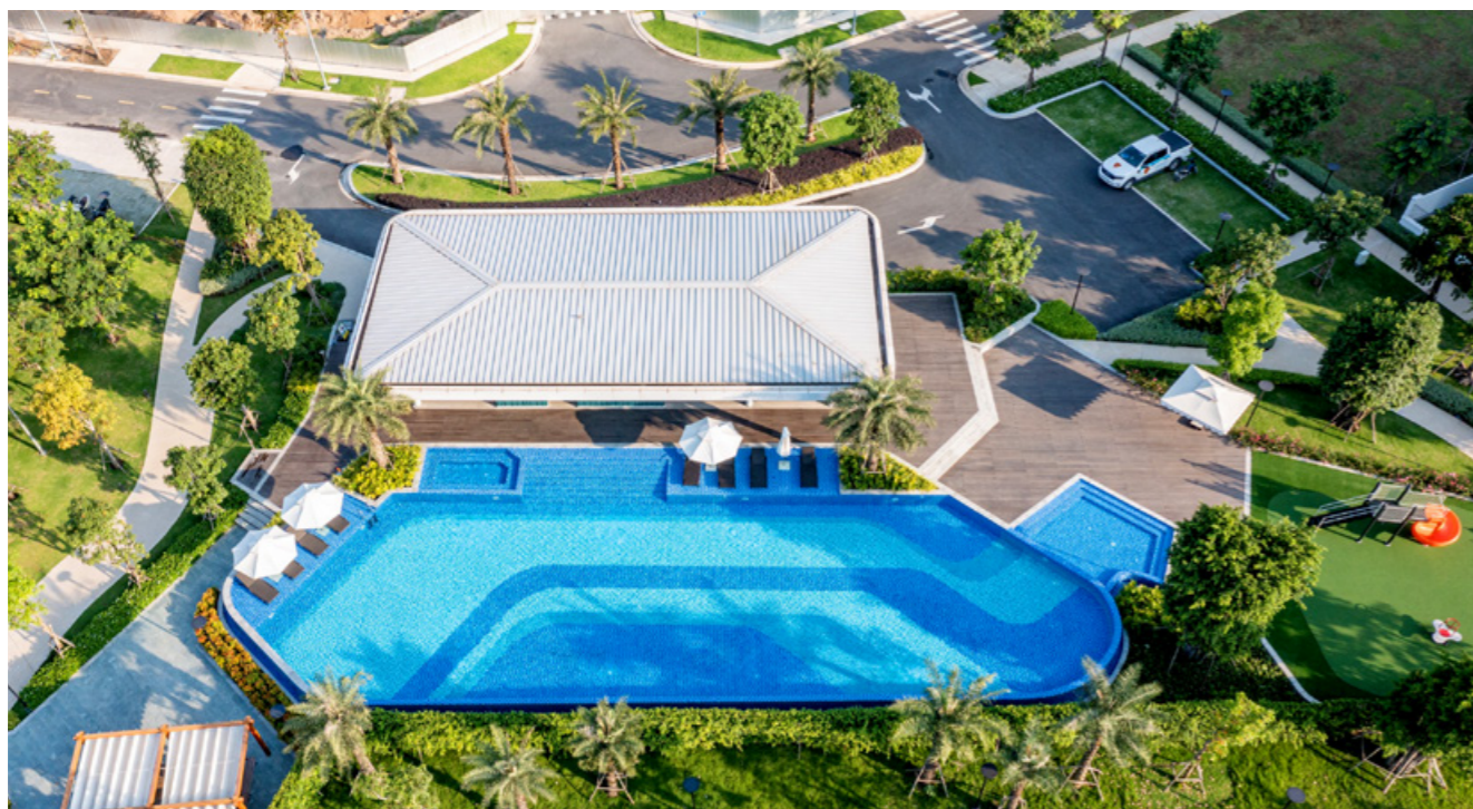
Clubhouse Forest đã hoàn thiện vào tháng 6/2020.