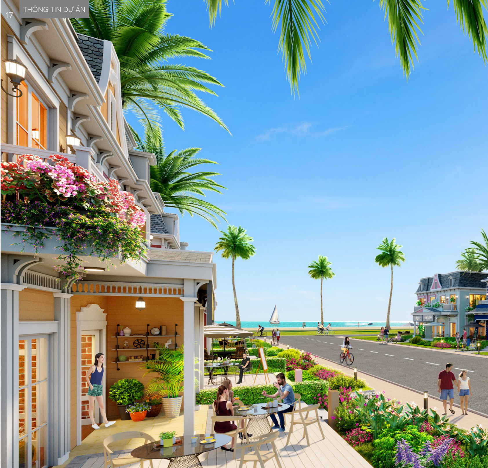
Shop villa Wonderland – phiên bản nâng cấp hoàn hảo của nhà phố thương mại.