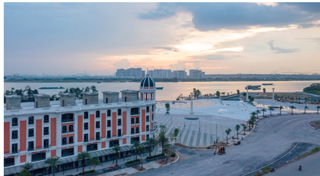
Tổ hợp Quảng trường - Bến du thuyền Aqua Marina dự kiến khai trương tháng 7/2021.