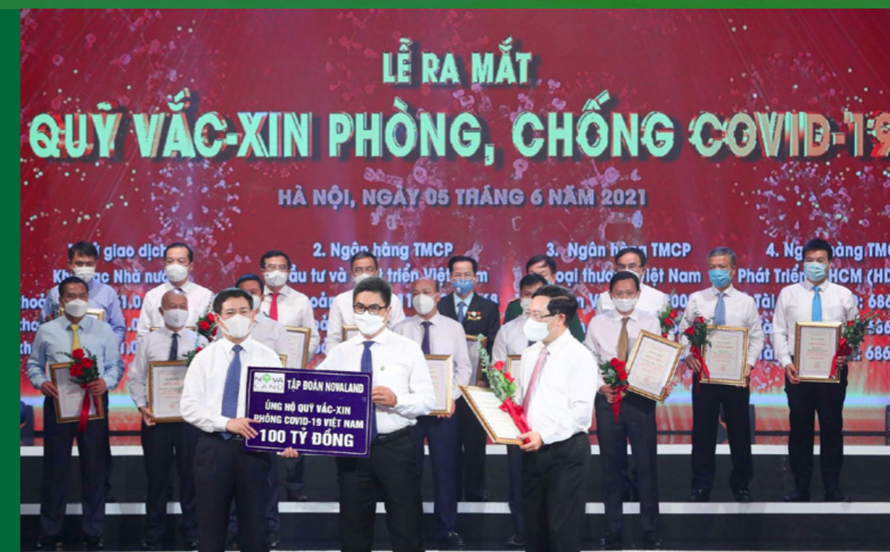
Tập đoàn Novaland chung sức đồng lòng cùng Quỹ vắc-xin phòng, chống Covid-19.

Quỹ vắc-xin dự kiến cần khoảng 25.200 tỷ đồng để tiêm phòng cho 75 triệu người, trong đó, ngân sách Trung ương khoảng 16.000 tỷ đồng; ngân sách địa phương chi và huy động đóng góp của các doanh nghiệp, tổ chức khoảng 9.200 tỷ đồng. Tính đến nay, Quỹ vắc-xin đã và đang tiếp tục được nhiều đơn vị, doanh nghiệp, cá nhân, tổ chức chung tay đóng góp để đồng hành Chính phủ, chia sẻ khó khăn cùng Chính phủ cho mục tiêu người Việt được tiếp cận vắc-xin nhanh nhất, sớm nhất và rộng nhất, trong đó có Tập đoàn Novaland.