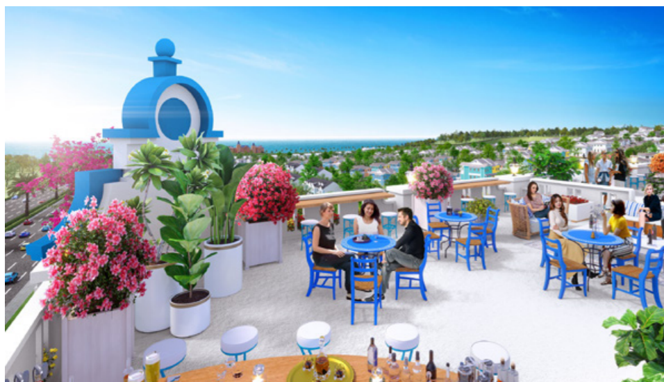
Tầng thượng của boutique hotel tại NovaWorld Phan Thiet với không gian mở và tầm nhìn biển hiếm có rất thích hợp để kinh doanh dịch vụ F&B.

Dự kiến khi NovaWorld Phan Thiet vận hành trong hai năm tới, đúng vào thời điểm hoàn thành của hàng loạt công trình trọng điểm và nền du lịch từng bước phục hồi, đây sẽ là loại hình giúp nhà đầu tư “hái ra tiền” khi đón dòng khách trong nước lẫn quốc tế.