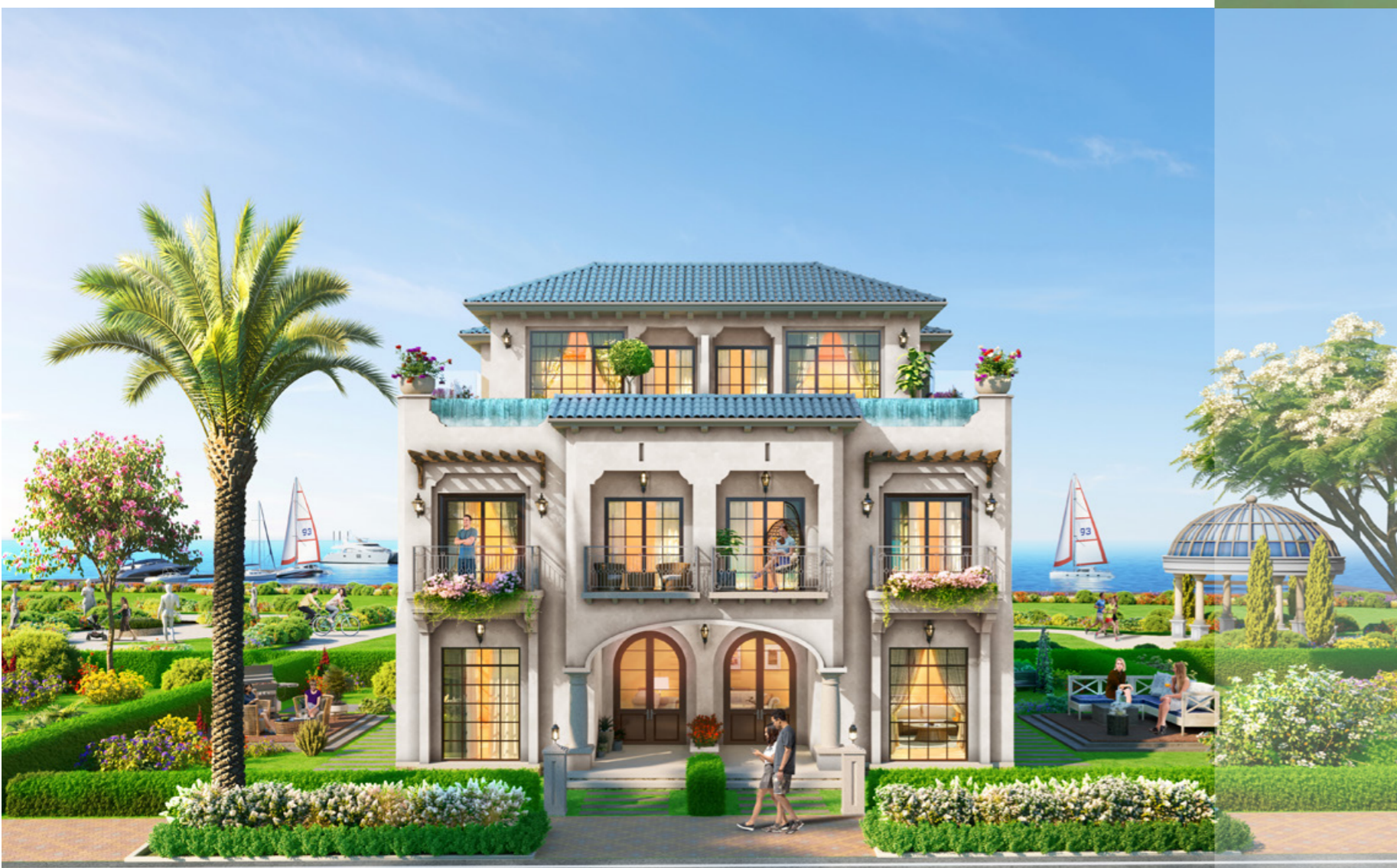
Phối cảnh biệt thự song lập công viên đang được giới thiệu tại Habana Island.

Website: https://novaworldhotram.vn/habana-island/