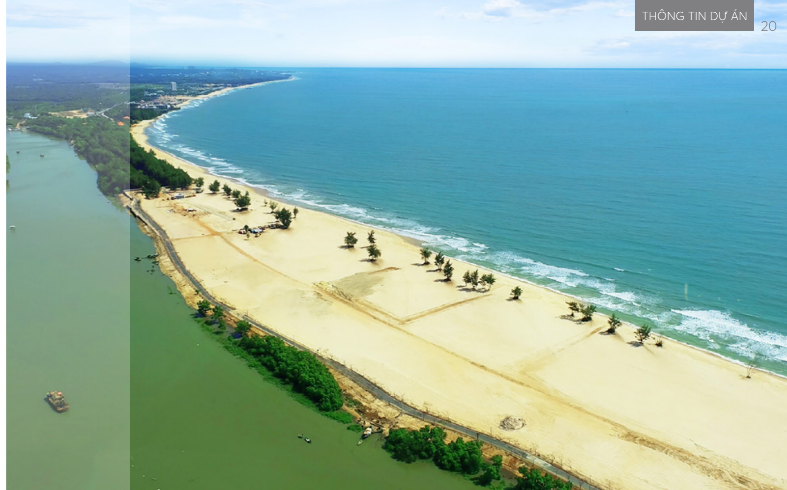
Địa thế sông biển giao hoà tại Habana Island nhìn từ flycam.

như một chốn yên bình để tránh khỏi cặp mắt của công chúng. Tính "sưu tầm" của phân khúc này dựa trên yếu tố khan hiếm. Mỗi BĐS sẽ như tác phẩm nghệ thuật có một không hai, hay chiếc đồng hồ đắt giá phiên bản giới hạn (limited editon).