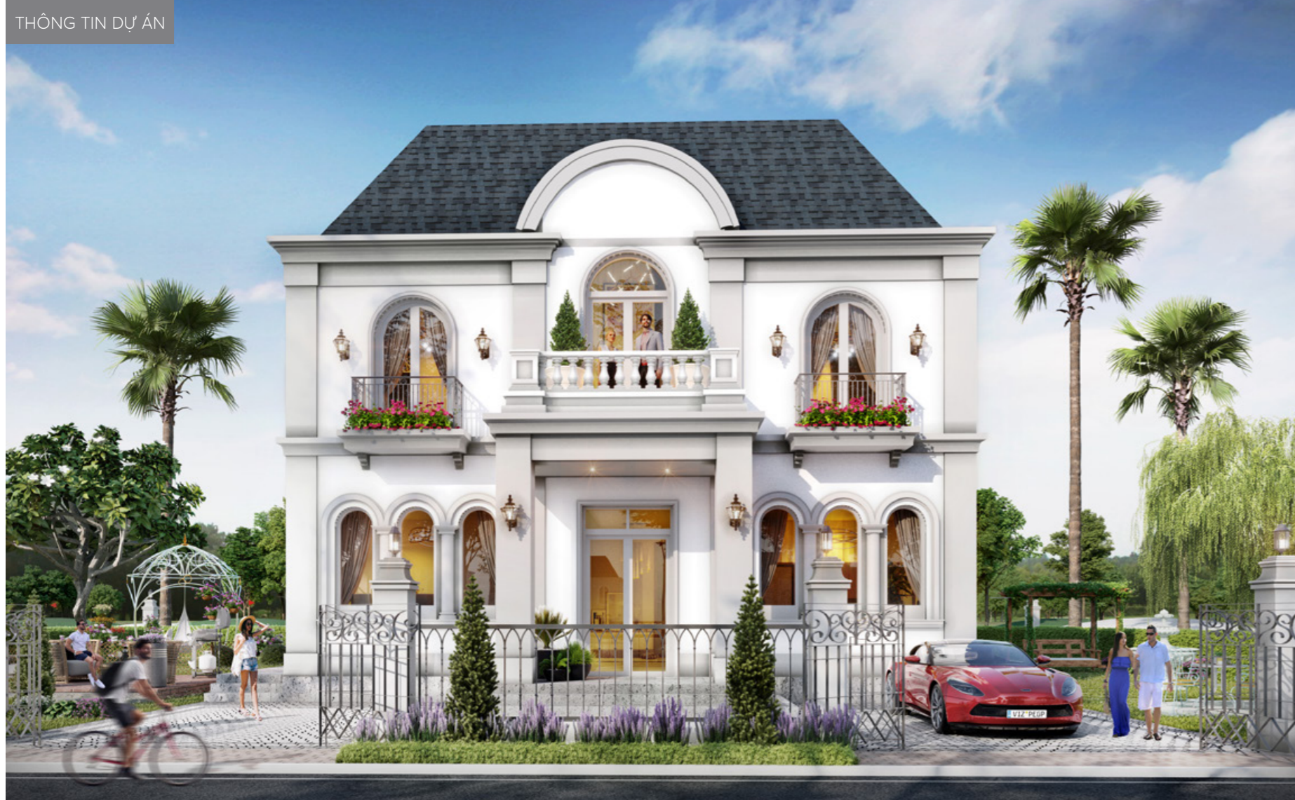
PGA Golf Villas có kiến trúc tinh tế, diện tích lớn và tích hợp nhiều tiện ích hạng sang đi kèm.

Năm 2020, Bloomberg đã có thống kê ấn tượng tại Anh, lần đầu tiên doanh số BĐS tăng vọt 1.900% ở những nơi có không gian sống dành cho tất cả thành viên trong gia đình. Việc này cũng đã tạo nên nhiều thay đổi trong quan điểm chọn lựa các căn second home tại Việt Nam.