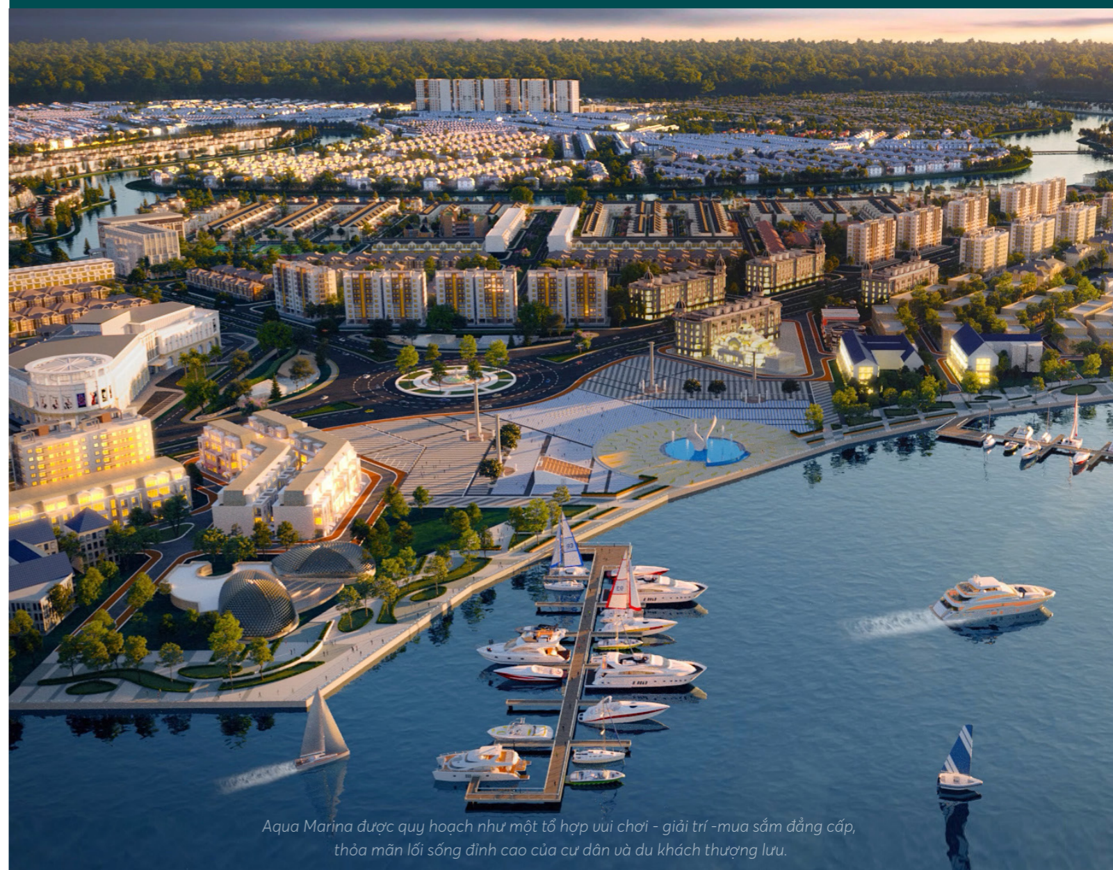
Aqua Marina được quy hoạch như một tổ hợp vui chơi - giải trí - mua sắm đẳng cấp, thỏa mãn lối sống đỉnh cao của cư dân và du khách thượng lưu.

Theo giới đầu tư, Aqua City không chỉ thỏa mãn nhu cầu "sống như nghỉ dưỡng" mà uy tín của thương hiệu Novaland và hệ sinh thái NovaGroup còn đảm bảo sản phẩm gia tăng giá trị khi đi vào vận hành.