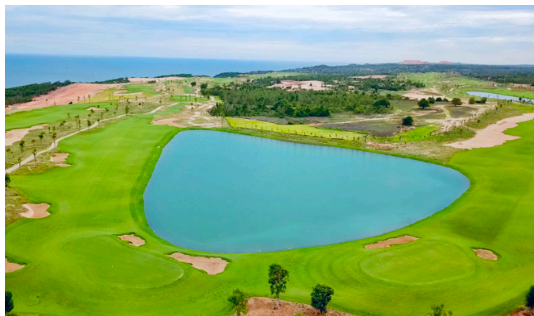
Chủ nhân PGA Golf Villas có thể xem trực tiếp những giải đấu đẳng cấp tại cụm sân golf PGA độc quyền 36 hố.

Biệt thự PGA Golf Villas hội tụ nhiều ưu điểm đầu tư, được giới chuyên gia đánh giá là dòng biệt thự golf hiếm hoi xứng đáng với vai trò biểu tượng, làm nên thương hiệu cho chủ sở hữu qua đặc quyền trải nghiệm loạt tiện ích "trong mơ" tại Việt Nam.