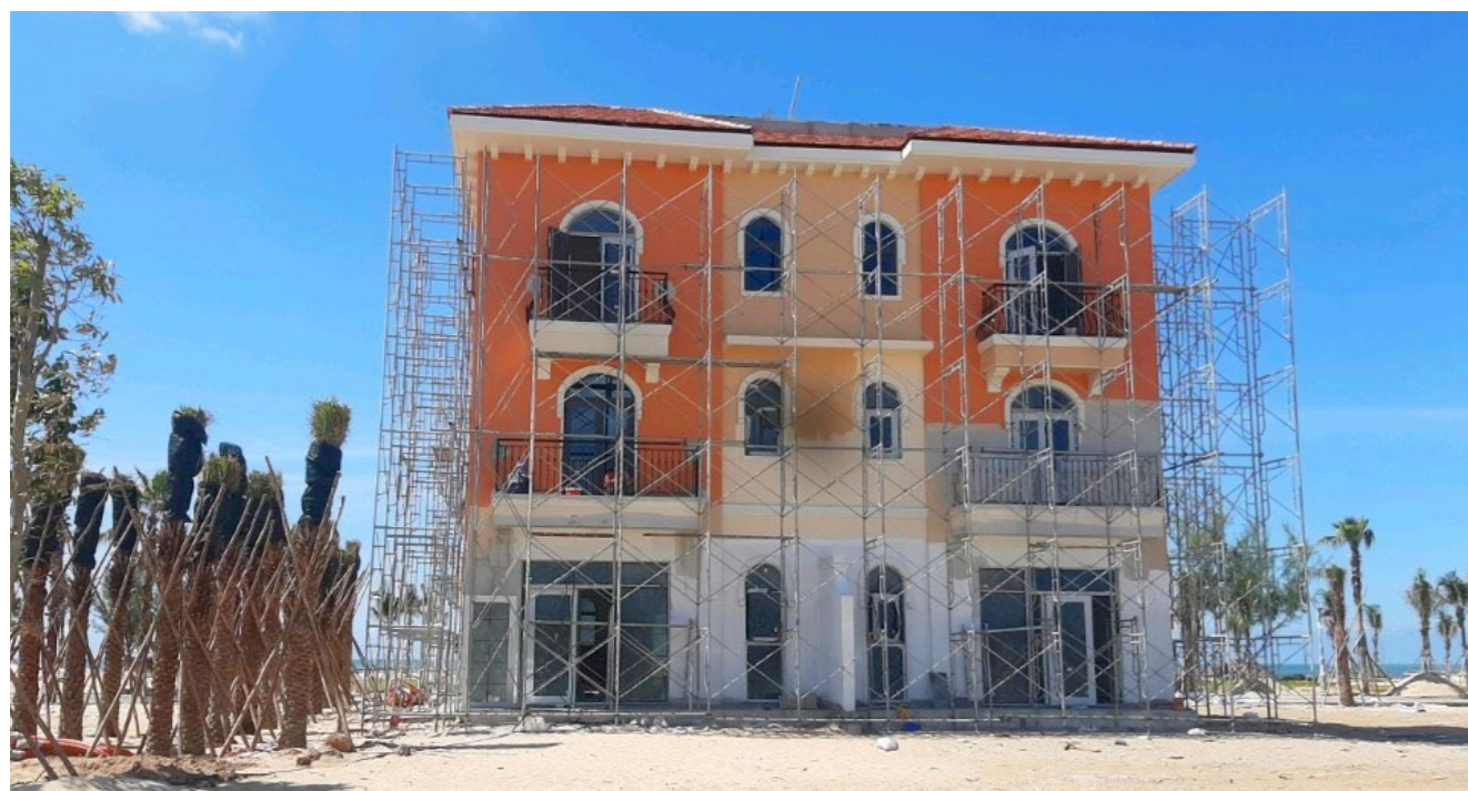
Nhà mẫu tại phân kỳ Habana Island, NovaWorld Ho Tram đang được hoàn thành. Ảnh thực tế tại công trường tháng 7/2021.